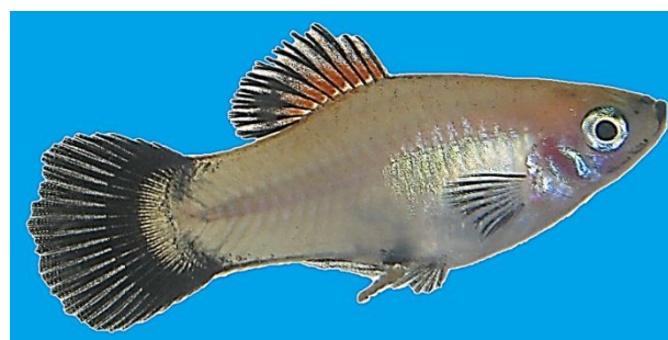
شکل ۱: ماهی پلاتی

ماهی پلاتی دارای بدن کوتاه و نسبتاً عمیق، دهان فوقانی و چشم‌هایی نسبتاً بزرگ است (Valente et al., 2021). در این گونه، باله پشتی در عقب بدن، باله لگنی در موقعیت شکمی و باله سینه‌ای در قسمت جلو قرار دارد. این ماهی دارای باله دمی گردی (شکل ۱) است که در جنس نر آن، در انتهای دم زائده بلندی وجود دارد که آن را از جنس ماده متمایز می‌کند (Rees et al., 2022). تعداد شعاع‌های نرم باله پشتی ۱۰-۸ عدد است. بیشترین عمق بدن حدود ۲ برابر طول استاندارد گزارش شده است (Froese and Pauly, 2022). ماهی پلاتی ممکن است با ماهی دم‌شمشیری ( X. helleri ) اشتباه گرفته شود، اما به واسطه برخورداری از لکه‌های تیره و بزرگ در قاعده دم قابل تمایز است (Powell et al., 2020).