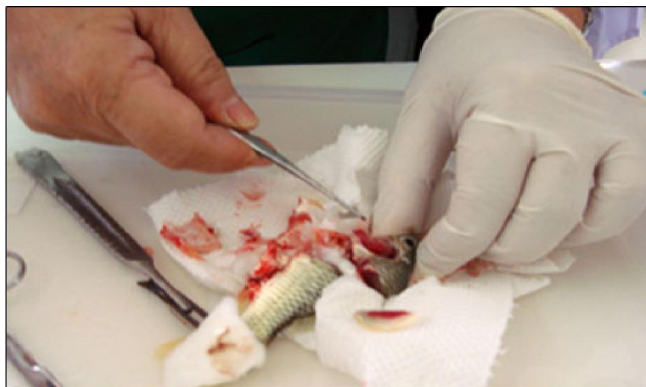
تصویر شماره ۱۲: کالبد گشائی ماهی مبتلا جهت نمونه برداری تشخیصی