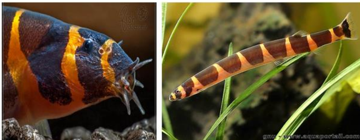
شکل ۱: جویبارماهی کوهلی ( Pangio kuhlii )

وضعیت تاکسونومیک: این گونه به دسته شعاع‌بالگان، راسته