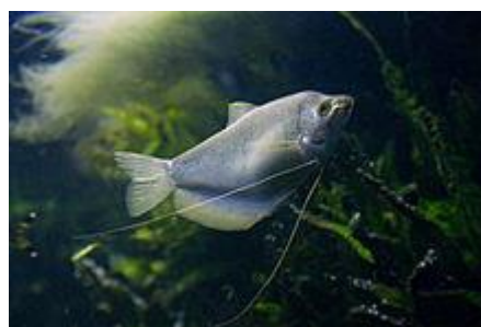
شکل ۴: ماهی گورامی مهتابی ( Trichogaster microlepis )