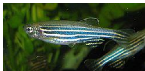
شکل ۲: زبرا دانیوس ( Branchydanio rerio )