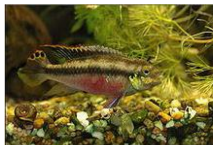
شکل ۳: ماهی سیکلاید کری بن سیس ( Pelvicachromis pulcher )