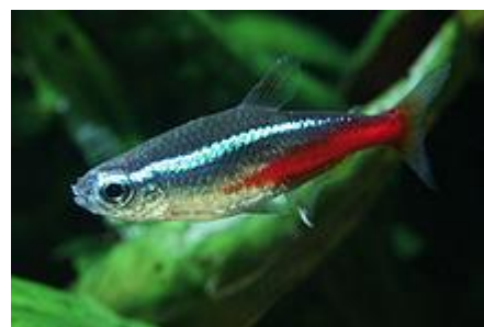
شکل ۱: ماهی نئون تترا ( Paracheirrodon innesi )

محیط نگهداری شده و روزانه به میزان سه در صد از وزن بدن ماهی غذادهی شود (شکل ۵).