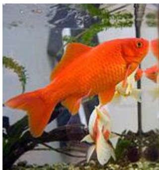
شکل ۵: ماهی قرمز حوض ( Carassius auratus )

محیط نگهداری شده و روزانه به میزان سه در صد از وزن بدن ماهی غذادهی شود (شکل ۵).