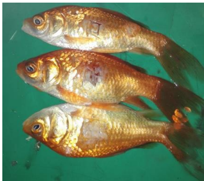
شکل ۱: مراحل ترمیم و بهبودی بافت برش داده شده با استفاده از پماد تهیه شده از عصاره هیدرو الکلی برگ زیتون در ماهیان قرمز ( C. auratus )