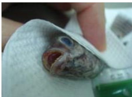
تصویر شماره ۳: نکرورز محوطه دهانی