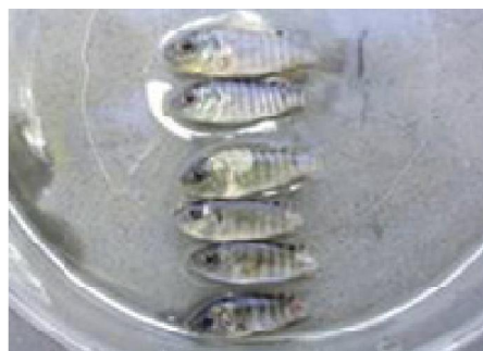
تصویر شماره ۲: سایش و خوردگی باله دمی