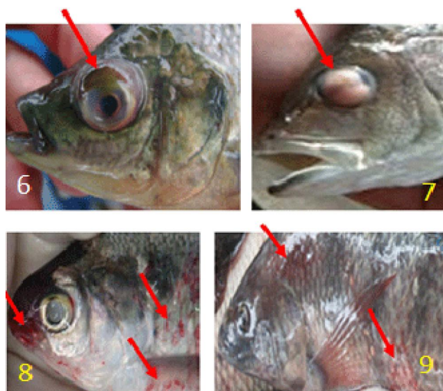
تصاویر شماره ۶-۹: علائم بالینی شاخص در استرپتوکوکوزیس بیرون زدگی چشم ها و خونریزی در قاعده باله ها و سرپوش آبششی

(Parera et al. , 1994; Eldar et al. , 1995; می‌شود)