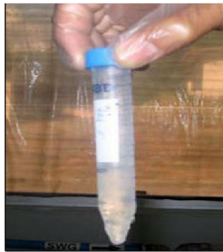
تصویر شماره ۱۳: آماده سازی بافت های عصبی و چشم جهت آزمایش های تشخیصی