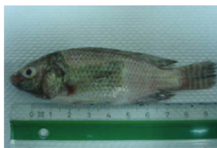
تصویر شماره ۴: ضایعات منجر به عارضه زین اسبی

گونه‌های استرپتوکوک که می‌توانند ماهیان را آلوده کنند قابل سرایت به انسان نیز هستند، ولی گونه غالب بیماری‌زای مشترک بین انسان و آبزیان، گونه استرپتوکوکوس اینیایی است. عفونت‌های استرپتوکوکی در ماهی‌ها اغلب متعاقب برخی استرس‌های زیست‌محیطی بروز می‌نمایند. این بیماری در صورت مناسب نبودن شرایط محیطی در سیستم‌های مدار بسته نیز امکان وقوع خواهد یافت.