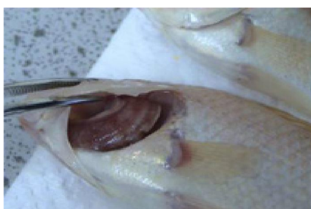
تصویر شماره ۵: نکرورز آبشش