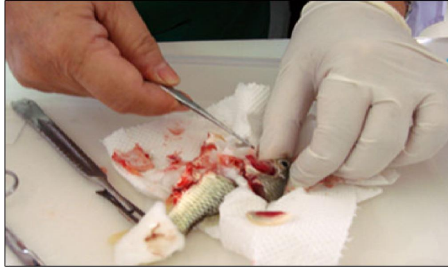
تصویر شماره ۱۲: کالبد گشائی ماهی مبتلا جهت نمونه برداری تشخیصی