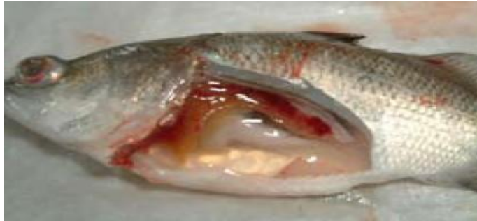
تصویر شماره ۱۱: کالبدگشائی ماهی مبتلا به استرپتوکوکوزیس تجمع مایعات خونی سرروز مانند در محوطه شکمی، طحال بزرگ و پر خون، کبد کم رنگ