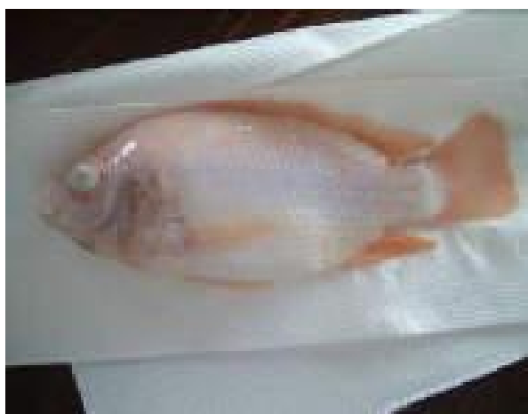
تصویر شماره ۱۰: ماهیان بیمار و نمایش عارضه اگزوفتالمی و چشمان مات

کبد بیرنگ، تورم در اطراف قلب و کلیه‌ها دیده می‌شود. همچنین برخی از گونه‌های استرپتوکوکوس باعث ایجاد عفونت و التهاب در مغز و سیستم عصبی ماهیان مبتلا می‌شوند که می‌تواند بیانگر علت شنای نامنظم و مارپیچی در آنها باشد (تصویر شماره ۱۱).