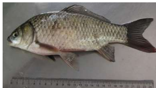
شکل ۲: ماهی کاراس پروس ( Carassius gibelio ) صید شده از

با فرض اینکه آیا احداث تله‌های رسوب‌گیر در تالاب انزلی، موجب بهتر شدن وضعیت ذخایر می‌شود یا تنوع و ترکیب گونه‌ای ماهیان تالاب انزلی در چند سال اخیر بهبود یافته و با اهداف چون شناسایی ماهیان بومی و غیر بومی تالاب انزلی، بررسی تنوع، فراوانی و پراکنش ماهیان اقتصادی تالاب انزلی به عنوان یکی از زیر پروژه‌های طرح جامع تالاب انزلی انجام گرفت که مطالعه حاضر بخشی از کارهای انجام یافته می‌باشد. در تالاب انزلی، پژوهش‌های مختلف ماهی‌شناسی به طور پراکنده در سنوات مختلف انجام شده است. Holcik (۱۹۹۲) گزارش نمود در حوزه آبریز تالاب انزلی ۴۱ گونه و زیرگونه ماهی وجود دارد که ۳۱ گونه در داخل تالاب زیست می‌کند. عباسی و همکاران (۱۳۷۸) تعداد ۴۸ گونه و زیرگونه ماهی از حوضه تالاب انزلی گزارش نموده‌اند. گزارش‌های موردی فراوانی از محققین طی بازده زمانی ۵۰ ساله به‌خصوص در دهه اخیر بر ماهیان تالاب انزلی وجود دارد که در حال حاضر، مهم‌ترین آن شامل مطالعات جامع تالاب (سازمان محیط زیست استان گیلان) می‌باشد. گونه ماهی کپورچه پروس Carassius gibelio (Linnaeus, 1758) یکی از گونه‌های غیر بومی ایران و نیز تالاب انزلی است که فراوانی بالای ۲۵ درصد داشته و در همه ایستگاه‌های تعیین شده، صید گردید. بنابراین، مطالعه حاضر جهت ارائه راهکارهای مناسب برای اتخاذ اقدامات لازم انجام شده است (شکل ۲).