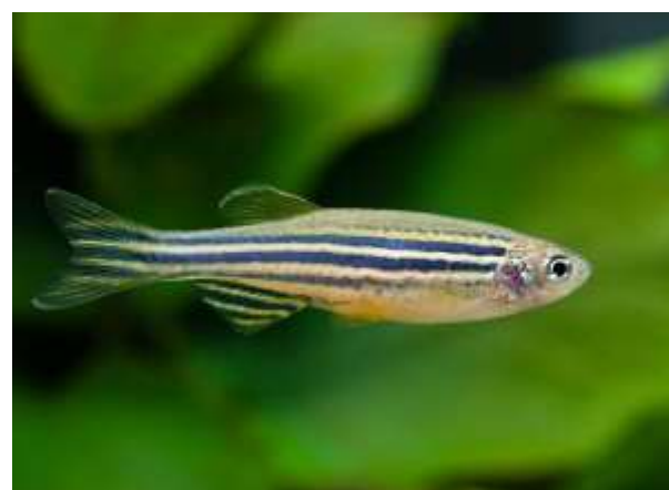
شکل ۱: ماهی گورخری ( Danio rerio ). (Fishipedia, 2021).

یک ماهی گورخری ماده می‌تواند در هر تخم‌ریزی صدها تخم تولید کند. با توجه به اینکه تخمک‌ها برای بارور شدن خارج از بدن آزاد می‌شوند، تولید این تعداد تخمک به بسیاری از فرزندان اجازه می‌دهد تا قبل از رسیدن به بزرگسالی حتی با مرگ برخی از آنها، از طریق فرآیند رشد زنده بمانند. تخم‌ها، با قطر حدود ۰/۷ میلی‌متر روی بستر رها می‌شوند و مراحل رشد را آغاز می‌کنند. اگرچه تخم‌های ماهی گورخری چسبنده نیستند و تمایل به رهاسازی در بستر آماده ندارند، اما تخم‌ها هنگامی که در آب رها می‌شوند، حتی در مواردی که به‌وسیله اسپرم ماهی نر بارور نشده باشند، فعال می‌شوند.