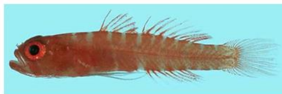
شکل ۱: گاوماهی کوتوله ( Trimmatom nanus ). (طول استاندارد: ۸ میلی‌متر) (Froese and Pauly, 2021)

اولین خار باله پشتی کمی دراز و کشیده شده است. سه شعاع ابتدایی باله شکمی منشعب شده‌اند. پنجمین شعاع باله شکمی غیرمنشعب است. پنجمین شعاع باله شکمی نیز غیرمنشعب است. فلس‌های پیش باله پشتی ۱ وجود ندارند. نواحی لب و سرپوش آبششی فاقد فلس هستند. در این گونه طول استاندارد در ماده‌های بالغ به ۸-۱۰ میلی‌متر می‌رسد (Randall and Goren, 1993; Froese and Pauly, 2021). بزرگ‌ترین نمونه به طول استاندارد ۱۰/۲ میلی‌متر از نوک فک بالا تا انتهای اسکلت باله دم اندازه‌گیری شده است (Winterbottom, 2003). عمق بدن این گونه تقریباً ۱۶/۴ درصد از طول کل بدن است. این گونه دارای چشم‌های بزرگ به قطر تقریباً ۴۲/۴ درصد طول سر می‌باشد (MNPH, 2013).