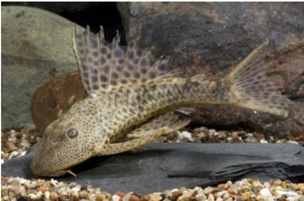
شکل ۱: گربه‌ماهی لجن‌خوار ( H. plecostomus ). اقتباس از (Edmond, 2020)

سینه‌ای به صورت افقی و دارای خارهای ضخیم و دندانه‌دار هستند که در رقابت بین نرها و همچنین حرکت مورد استفاده قرار می‌گیرند. باله پشتی دارای ۱ خار و ۸-۷ شعاع نرم است. باله مخرجی دارای ۱ خار و ۵-۳ شعاع نرم است (Froese and Pauly, 2019). در این گونه، دم استوانه‌ای شکل است و پهن و فشرده نیست. ماهیان نر دارای باله‌های سینه‌ای ضخیم شده‌ای هستند که به رنگ صورتی مایل به قرمز در می‌آیند. البته، باله‌های سینه‌ای در ماده‌های بالغ که از بالا مشاهده می‌شوند، ضخیم‌تر به نظر می‌رسند (CABI, 2020). با این حال، تفاوت قابل ملاحظه‌ای بین جنس‌های نر و ماده وجود ندارد.