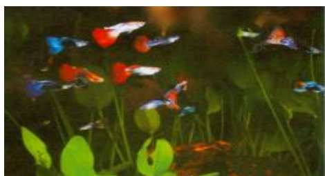
شکل ۱: ماهی گویی

در حدود ۳۵ سویه رنگی مختلف ماهی گویی به صورت فعال در بازار تجاری حضور دارند. هرچند که برخی از افراد به گونه‌های غیرتجاری ماهی گویی علاقه مند می‌باشند، ولی معمولاً این گونه‌ها چندان مقاوم نمی‌باشند. صنعت پرورش ماهیان زینتی گرمسیری بر اساس خصوصیات ژنتیکی داخل گونه‌ای و تفاوت‌های فنوتیپی سویه‌ها استوار بوده و سود آور می‌باشد.