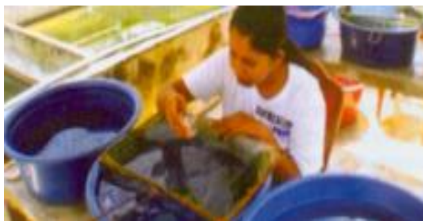
شکل ۳: به منظور جلوگیری از بروز استرس هیچگاه نباید ماهی دور از آب نگهداری شود

مدیریت استرس و امنیت در مزارع ماهیان گرم‌آبی دو روی یک سکه هستند. فعالیت‌های آبی‌پروری نظیر برداشت، ذخیره‌سازی، قطع غذا قبل از حمل، بسته بندی ماهی‌ها جملگی استرس‌زا می‌باشند؛ لذا این عملیات باید با احتیاط کامل و بدون تاخیر انجام شود. زمانی که محرک‌های ایجاد کننده استرس به سرعت از محیط حذف شده و اجازه استراحت به ماهی داده شود، وضعیت آبی‌پروری به حالت اولیه بر خواهد گشت (شکل ۳). چنانچه استرس مزمن گردد، آبی‌پروری در نهایت دچار علائمی از جمله ضعف و یا تاخیر در رشد و ضعف درسیستم ایمنی خواهد شد.