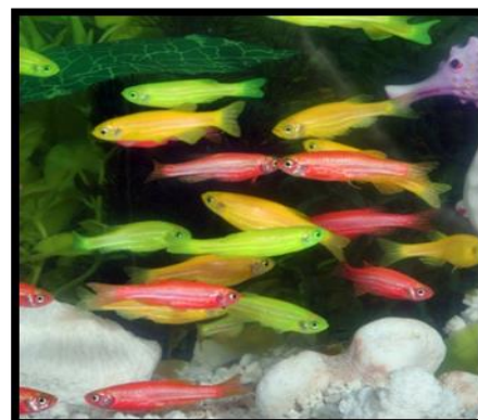
شکل ۱: گورخر ماهی تراریخته تولید شده با استفاده از ژن GFP، RFP و رنگ‌های تولید شده با استفاده از مهندسی ژنتیک و تغییر اسید آمینه‌های پروتئین مولد ژن رنگ

dsRed (مولد رنگ قرمز) از مرجان قارچی ( reniformis Entacmaea sp.)، شقایق دریایی ( Discosoma sp.)، مرجان سنگی ( Montipora efflorescens ) و شقایق ونوس ( Anemonia sulcata ) را می‌توان برشمرد که حاوی رنگ‌های زیبایی می‌باشند (Chiang et al. , 2014). برای اینکه رنگ‌های متنوع بیشتری ایجاد گردد، چنانچه دو لاین ماهی گورخری حاوی پیشبر (mylz2) و پروتئین (GFP) و (RFP) با هم تلاقی داده شود، نسل حاصل رنگ نارنجی فلورسنس دارد. با مخلوط کردن عصاره استخراج شده عضله دو ماهی با عضلات فلورسنس قرمز و سبز، رنگ‌های فلورسنسی بینابینی از سبز، زرد، نارنجی تا قرمز دیده می‌شود (شکل ۱) (Wan et al. , 2002). بنابراین هیچ محدودیتی از نظر تولید رنگ ماهی تراریخته وجود نخواهد داشت. می‌توان دو رنگ را با استفاده از پیشبرهایی که قدرت تولید رنگ فلورسنس متفاوتی دارند با نسبت‌های متفاوت با هم مخلوط کرد.