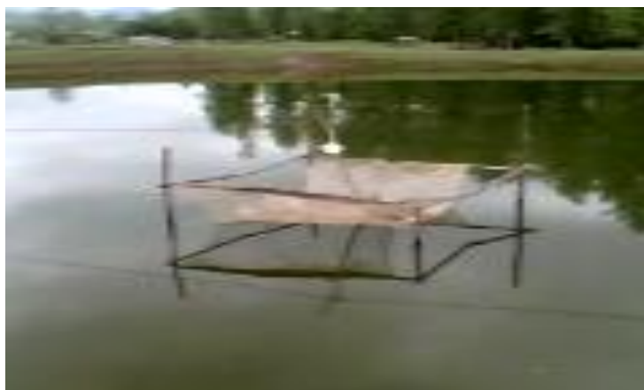
شکل ۱: آشیانه ساختگی برای تجمع لاروهای شیرونومیده

جهت نمونه برداری از کف، استخر به ۴ منطقه (A,B,C,D) تقسیم شد (شکل ۲). نمونه برداری از هر منطقه، در هر بار نمونه برداری ثابت نبود بلکه بصورت پراکنده از سه نقطه در همان منطقه انجام گرفت. نمونه برداری از کف استخر با بنتوز گیر (وان- ون گراب) با قایق توسط دو سر نشین انجام شد. محتویات نمونه بردار برای هر منطقه در داخل سطل ریخته شد. سپس مواد آلی موجود در الک (۱۶ mash) بتدریج با آب خارج گردید و لاروهای شیرونومیده با پنس برداشته و شمارش اولیه شدند. سپس لاروهای شیرونومیده هر منطقه را جداگانه با فرمالین ۴ درصد تثبیت و برای مطالعه بیشتر به آزمایشگاه انتقال یافت.