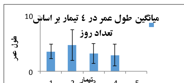
شکل ۱: بررسی طول عمر آرتمیای بالغ ماده در دوره تولیدمثل (در تیمارها عدد یک: غلظت ۵۰۰۰۰ سلول در میلی لیتر در دمای ۲۰±؛ عدد دو: غلظت ۵۰۰۰۰ سلول در میلی لیتر در دمای ۲۷±؛ عدد ۳: ۱۶۰۰۰۰ سلول در میلی لیتر در دمای ۲۰±؛ عدد ۴: ۱۶۰۰۰۰ سلول در میلی لیتر در دمای ۲۷± را نشان می‌دهد.

فیتوپلانکتونی فاکتورهای Between-subject بودند که غلظت فیتوپلانکتونی در درجه حرارت Nest گردید. در چهار تیمار بررسی شده غلظت و دما نتایج حاصل از آزمون تجزیه واریانس یک طرفه نشان داد که تفاوت طول عمر در دوره تولیدمثل بین تیمارها معنی‌دار نبوده است ( p=0.125 ) در غلظت‌های بالای جلبکی به نظر می‌رسد طول عمر کاهش یافته است. این نتایج در شکل یک ارائه شده است. همچنین طبق نتایج آنالیز آماری هیچ ارتباط معنی‌داری بین طول عمر یا بقاء آرتمیای در دماهای مختلف نشان نداد ( p=0.061 ).