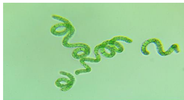
شکل ۲: موفولوژی جلبک Limnospira platensis

اشعه فرابنفش فعال‌ترین بخش فوتوشیمیایی از تابش خورشیدی است. با وجود جذب بالای آن در محیط‌های آبی، اثرات بیوشیمیایی، ژنتیکی و سیتوتوکسیک متعددی بر موجودات آبی ایجاد می‌کند. برای مقابله با استرس ناشی از UVR، بسیاری از گونه‌ها قادرند ترکیبات ضدآفتاب طبیعی را سنتز، تجمع یا از طریق رژیم غذایی خود کسب کنند تا از خود در برابر نور محافظت کنند (Sara et al. , 2022).