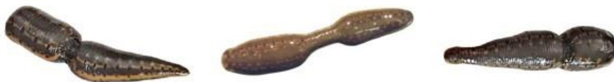
الف) تصویر بندی شدن بدن زالو به شکل ساعت شنی