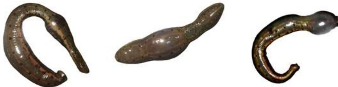
ج) تصویر بندی شدن بدن زالو به شکل سوسپسی