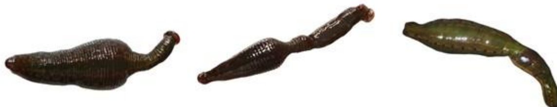
د) تصویر بندی شدن بدن زالو به شکل خمره ای

شکل ۳: بندی شدن بدن زالوی شرقی پس از خون‌دهی به شکل‌های ساعت شنی، تسبیحی، خمره‌ای و سوسپسی