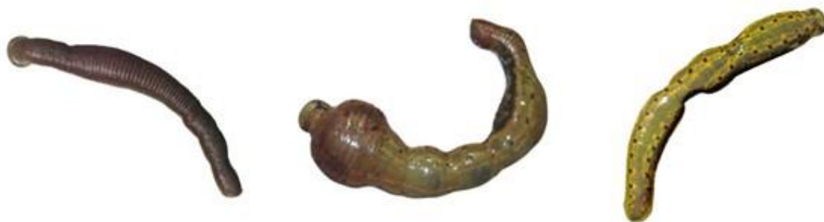
ب) تصویر بندی شدن بدن زالو به شکل تسبیحی