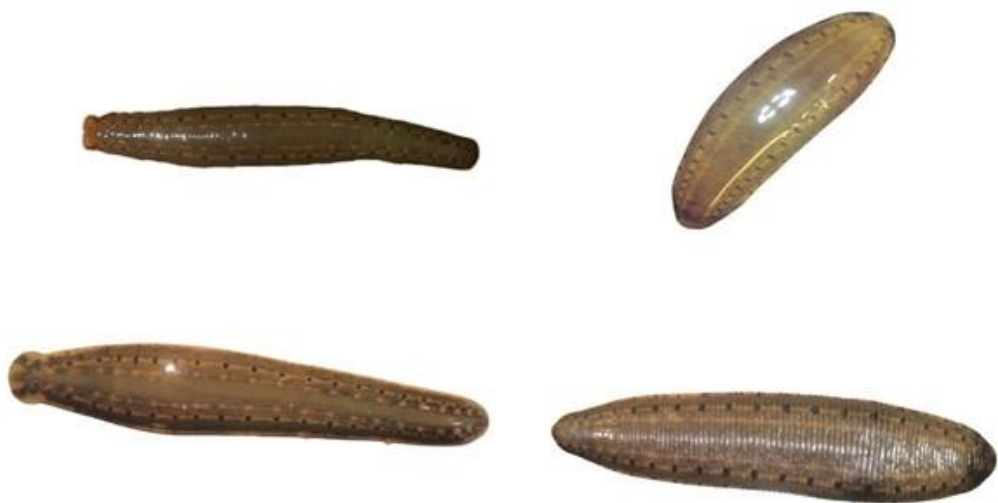
شکل ۵: زالوهای درمان شده با داروی Ceftriaxone پس از گذشت چهار هفته