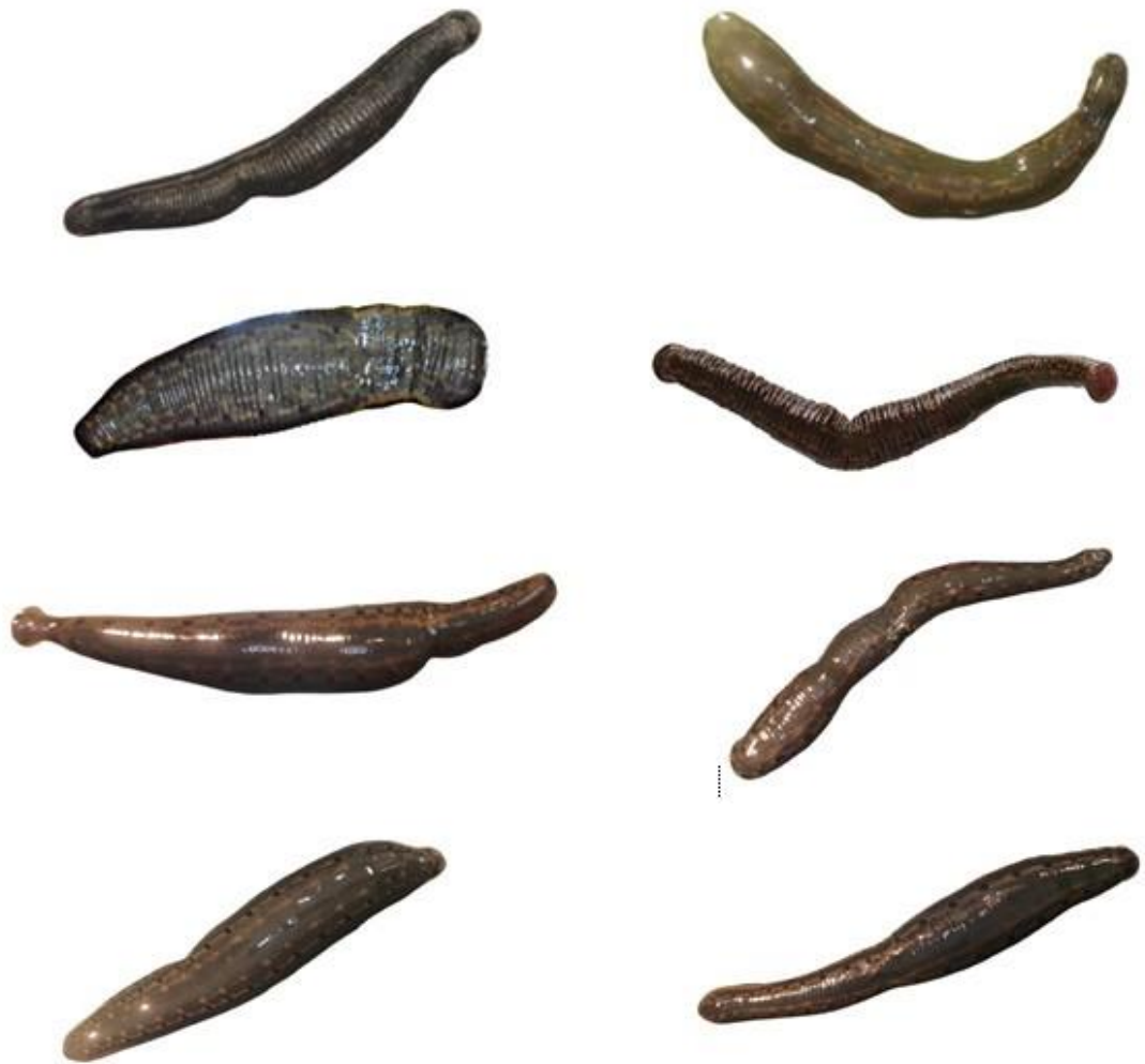
شکل ۴: زالوهای در حال درمان با داروی Ceftriaxone پس از گذشت دو هفته