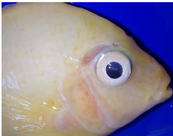
شکل ۲: سوراخ در سر ماهی سوروم مبتلا به انگل Hexamita در روده

کالبدگشایی شدند. کالبدگشایی ماهیان، تحت شرایط آسپتیک صورت گرفت. کشت باکتریایی در مدیای استاندارد نظیر بلاد آگار و مک کانکی صورت گرفت و پس از انکوباسیون مدیای استاندارد به مدت ۷۲ ساعت، رشد باکتری‌ها بررسی شد. مجرای گوارشی از بدن خارج‌سازی شد. مجرای گوارشی ماهیان با میکروسکوپ نوری و استریومیکروسکوپ مورد بررسی قرار گرفت. انگل‌های مجرای گوارشی، شمارش شده و در اتانول ۷۰٪ فیکس شده و به منظور بررسی، با گلیسرین پاکسازی شدند. تصویربرداری از انگل‌های مشاهده شده به کمک میکروسکوپ نوری نیکون مدل E600 مجهز به دوربین تاکسن مدل GT12 صورت گرفت.