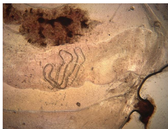
شکل ۶: انگل Capillaria جدا شده از روده ماهی سوروم

تشخیص تک یاخته Trichodina بر اساس ویژگی‌های کلیدی نظیر اندازه، حضور مژه (برای حرکت)، شکل گرد (هنگام مشاهده انگل از نمای پشتی) و وجود حلقه با دندان‌های قلاب‌مانند صورت گرفت. تشخیص انگل Ichthyophthirius multifiliis به کمک ویژگی‌هایی شامل تغییر اندازه انگل‌های پلئومورفیک و ماکرونوکلیوس C شکل انجام شد (Noga, 2010). همچنین تشخیص تفریقی انگل Ancyrocephalus از سایر جنس‌های منوژن، بر اساس اندازه و شکل هابتور صورت گرفت (Hussein et al. , 2019). علاوه بر این، در بررسی اندام‌های داخلی و مشخصاً مجاری گوارشی ماهیان، جنس‌های مختلفی شامل تک‌یاخته Hexamita ( Hexamita sp.) و نماتود Capillaria ( Capillaria sp.) (شکل ۶) و تخم‌های آن با میکروسکوپ نوری مشاهده شدند.