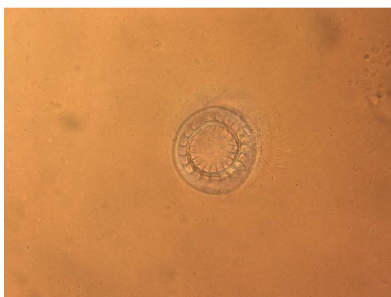
شکل ۴: انگل Trichodina جدا شده از ماهی سوروم