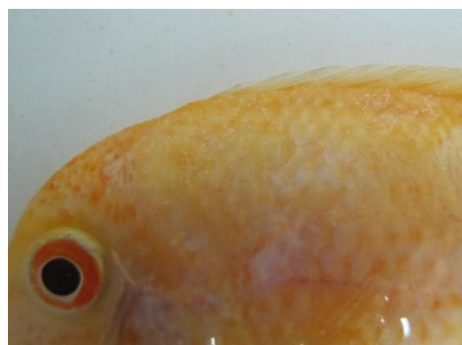
شکل ۱: لکه‌های سفید رنگ به علت حضور انگل Ichthyophthirius multifiliis روی پوست ماهی زینتی سوروم