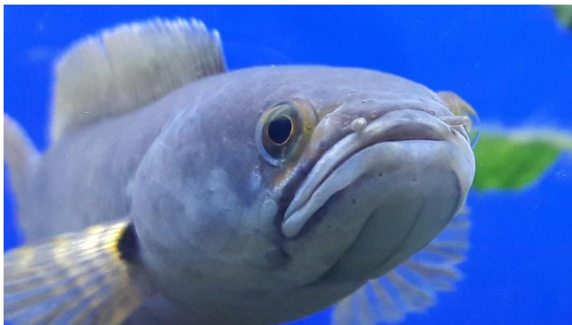
شکل ۳: کیفیت رنگ و سلامت ماهی سرماری C. gachua بومی رودخانه کاجو، در شرایط مطلوب پرورشی در اسارت