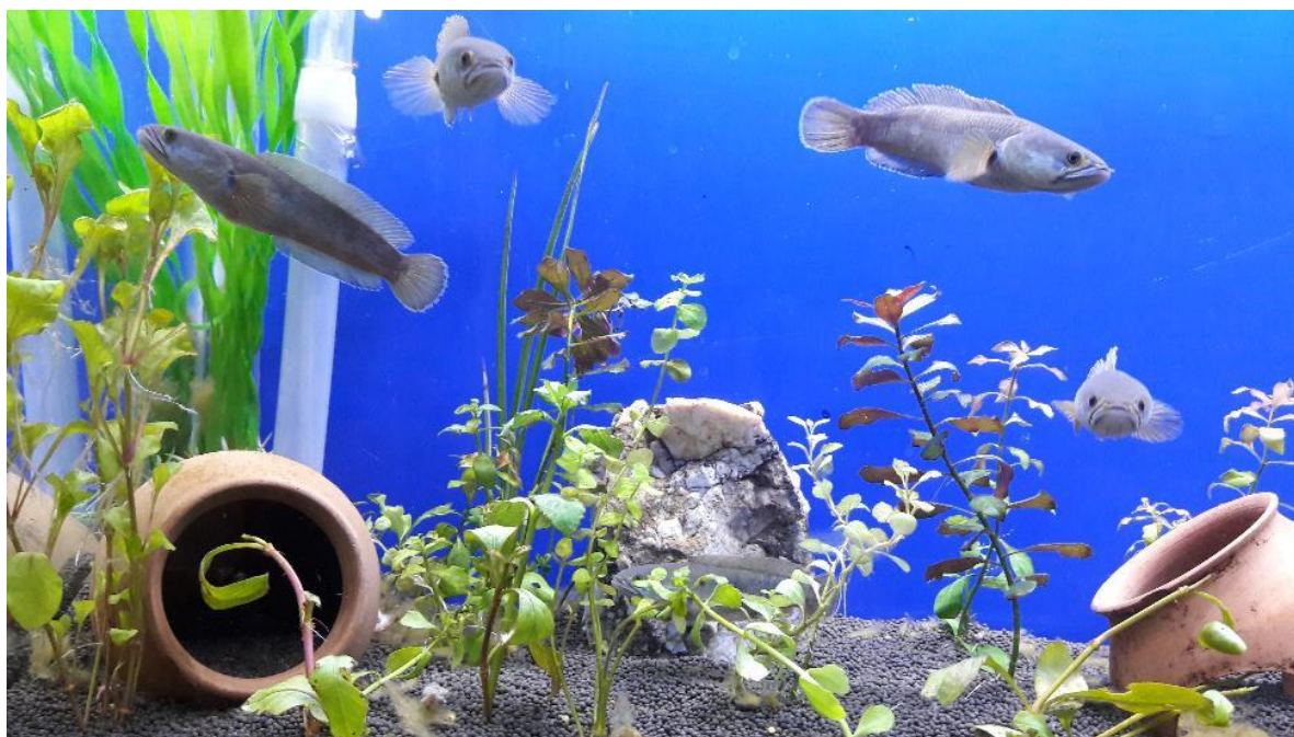
شکل ۴: نگهداری ماهی سرماری C. gachua بومی رودخانه کاجو، در شرایط اسارت با استفاده از دکوراسیون گیاهی و همینطور پناهگاه متعدد