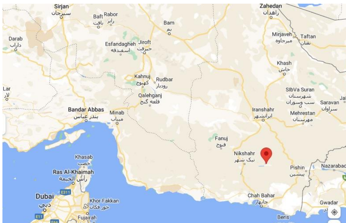
شکل ۱: نقشه ایستگاه نمونه برداری

کنترل شرایط مذکور، حفظ کیفیت شیمیایی آب با استفاده از سیستم‌های فیلتراسیون مرسوم کفایت می‌کند. بدین معنا که نتایج نشانگر عدم حساسیت بالای این ماهی نسبت به شرایط