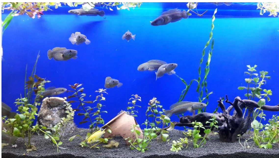
شکل ۲: نگهداری ماهی سرماری C. gachua بومی رودخانه کاجو، در شرایط اسارت