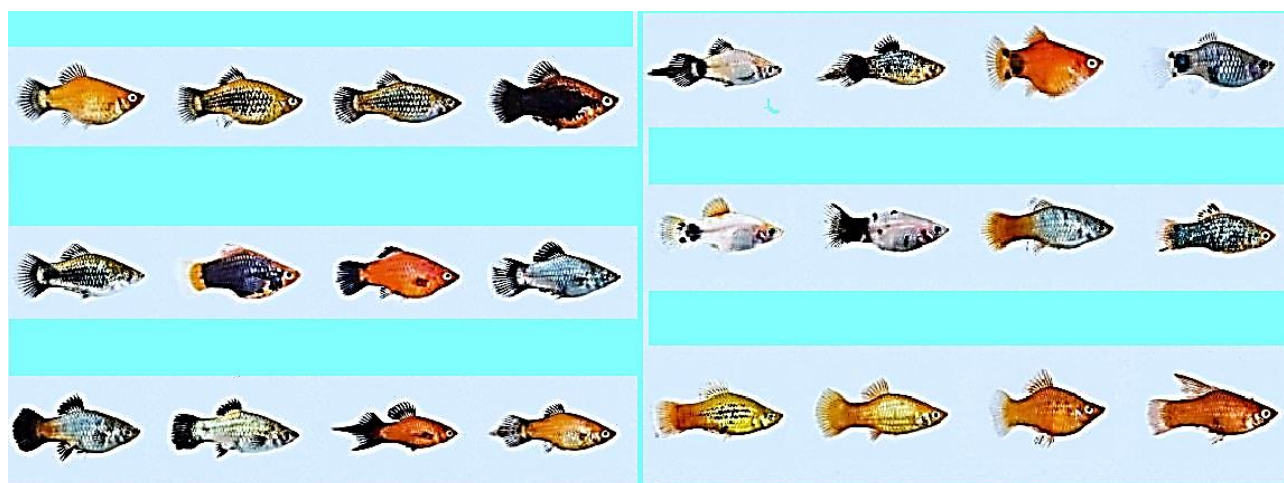
شکل ۳: تنوع رنگ بدن در ماهی پلاتی ( Xiphophorus maculatus ) (Morgan, 2021)