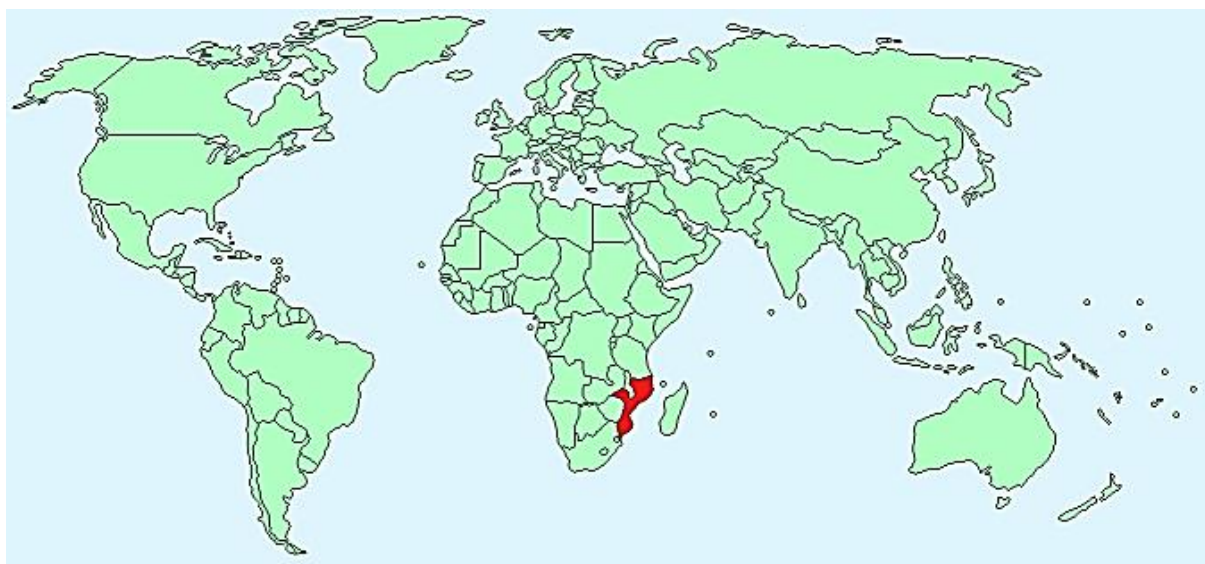
شکل ۴: محدوده پراکنش جغرافیایی کیلی‌فیش باله‌آبی ( Nothobranchius rachovii )

محدوده پراکنش این گونه در آفریقا شامل استخرها و باتلاق‌های موقت یا گودال‌های پر از آب در دشت‌های سیلابی پایین‌دست رودخانه‌های Pungwe و Zambezi (موزامبیک) می‌باشد (شکل ۴). این گونه احتمالاً در دشت‌های سیلابی سایر رودخانه‌های بین رودخانه Pungwe و Zambezi نیز یافت می‌شود (Shidlovskiy et al., 2010).