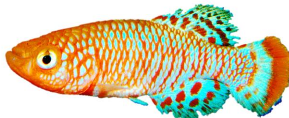
شکل ۲: کیلی‌فیش باله‌آبی ( Nothobranchius rachovii )

۲۶ در مقابل ۲۸-۳۳ عدد قابل تفکیک است. N. rachovii از گونه N. kadleci به واسطه شکل ناحیه پیشانی، تعداد شعاع‌های باله پشتی و مخرجی بیشتر، به ترتیب ۱۷-۱۵ در مقابل ۱۴-۱۳ عدد (Shidlovskiy et al., 2010) تمایز می‌یابد.