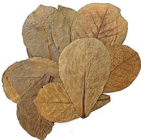
شکل ۵: برگ‌های Catappa (اقتباس از: Seedvondor, 2022)

N. rachovii از گونه‌های صلح‌آمیز محسوب می‌شود که می‌توان آن را با سایر کیلی فیش‌ها و ماهیانی که شرایط مشابه دارند، نگهداری کرد. در صورت تمایل، می‌توان کیلی فیش باله آبی را در کنار سایر گونه‌ها مانند مدادماهی (Pencilfish)، لوچ‌های کوهلی ( Kuhli loaches )، گورامی‌های رخشان و کروکینگ ( Corydoras catfish )، گورامی (Gouramis) و ... پرورش داد (Fishkeeper, 2022). هنگامی که این ماهیان در یک جامعه تخصصی نگهداری می‌شوند، آکواریوم‌ها باید از پوشش‌های گیاهی شامل گونه‌های شناور ۲ تشکیل شده باشند. افزودن مواد گیاهی مانند برگ‌های کاتاپا ۳ برای کمک به نرمی (کاهش غلظت یون‌ها) و اسیدی کردن آب توصیه می‌شود (شکل ۵)، زیرا این امر به ظهور بهترین رنگ در ماهی‌ها کمک می‌کند (Huber's Killi-).