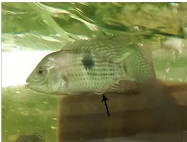
شکل ۱: مدفوع سفید رنگ (پیکان) نمایان از مخرج ماهی گرین ترور آلوده به انگل کاپیلاریا

پاکسازی شدند. به منظور درمان سایر ماهیان، اقدام به تجویز لوامیزول به مدت ۴۸ ساعت در هر ۷ روز یکبار به مدت ۲۱