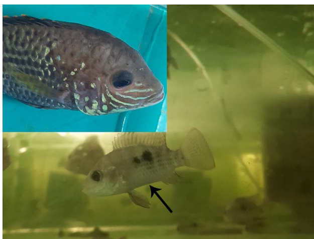
شکل ۲: لاغری و رنگ‌پریدگی بدن ماهی گرین ترور (پیکان) آلوده به انگل کاپیلاریا در مقایسه با گرین ترور با رنگ طبیعی