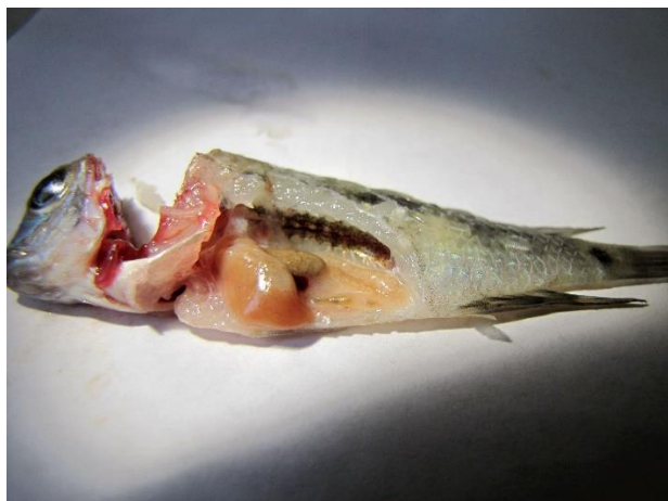
شکل ۳: ماهی گرین ترور کالبدگشایی شده

تجویز داروی ضد انگل لوامیزول به صورت خوراکی و به میزان ۲ میلی‌گرم به ازاء هر گرم غذا به مدت ۱۰ روز و ۲ میلی‌گرم به ازاء هر لیتر آب ۴۸ ساعت (تکرار درمان هفتگی یکبار به مدت ۴ هفته) به منظور درمان ماهیان در مرکز تکثیر و پرورش ماهیان زینتی، موثر واقع شد و تلفات ماهیان که پیش از تشخیص و آغاز درمان، به میزان ۱۵ عدد به صورت روزانه بود، کاملاً متوقف گردید و در بررسی مجدد ماهیان پس از گذشت ۲۸ روز، هیچ علائمی از بیماری و نیز تلفات مشاهده نشد.