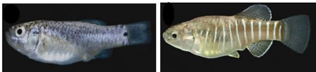
شکل ۱۰: نمای جانبی جنس نر (سمت راست) و جنس ماده (سمت چپ) گونه Aphanius sophiae . برگرفته از اسماعیلی و همکاران (۲۰۱۲)

گونه Aphanius sophiae (Heckel, 1847) - کپور دندان‌دار سوفیا یا کپور دندان‌دار گر (شکل ۱۰): بومی ایران است و Heckel (۱۸۴۷) آن را در حوضه کر توصیف نمود. این گونه دارای باله پشتی با ۱۵-۱۲ و باله مخرجی با