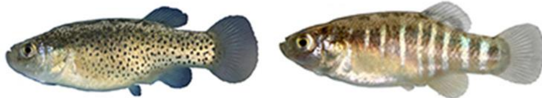
شکل ۹: نمای جانبی جنس نر (سمت راست) و جنس ماده (سمت چپ) گونه Aphanius vladykovi . برگرفته از اسماعیلی و همکاران (۲۰۱۴)

گونه Aphanius vladykovi (Coad, 1988) - کپور دندان‌دار زاگرس (شکل ۹): بومی ایران است و Coad (۱۹۸۸) آن را رودخانه کارون در حوضه تیگریس توصیف نمود. این گونه دارای باله پشتی با ۱۴-۱۱ و باله مخرجی با ۱۳-۱۱ شعاع نرم است. نرهای بالغ دارای نوارهای زرد رنگ در