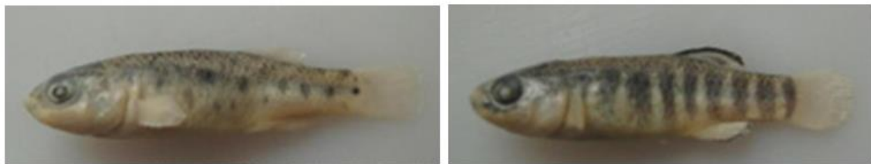
شکل ۶: نمای جانبی جنس نر (سمت راست) و جنس ماده (سمت چپ) گونه Aphanius isfahanensis . عکس از محمد صادق علوی یگانه

گونه Aphanius isfahanensis (Hrbek et al., 2006) کپور دندان‌دار اصفهان (شکل ۶): بومی ایران است و Hrbek و همکاران (۲۰۰۶) آن را در حوضه اصفهان توصیف نمودند. این گونه دارای باله پشتی با ۱۰-۱۳ و باله مخرجی با ۱۰-۱۲ شعاع نرم است و به‌وضوح از لحاظ ژنتیکی از سایر گونه‌ها به‌واسطه داشتن ۸۲ آپومورفی مولکولی متمایز است. جنس نر را می‌توان با داشتن لبه سیاه متمایز در باله‌های