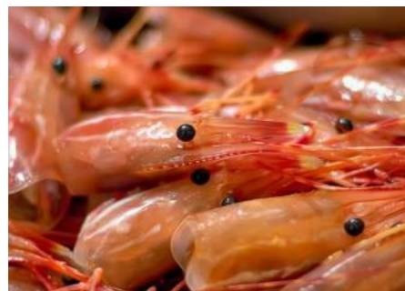
شکل ۱: ضایعات میگو پس از فرآوری شامل سفالوتوراکس و پوسته بخش شکمی

هر ساله با شروع فصل صید سخت‌پوستان به‌ویژه میگو، از دریا و برداشت آن از استخرهای پرورشی، کمیت‌های عظیمی از ضایعات (پوسته بخش شکمی و سر و سینه) به‌وسیله صنایع فرآوری میگو تولید می‌شود. تنها در اروپا، بخش آماری سازمان غذا و کشاورزی (FAOSTAT) تخمین می‌زند که سالانه بیش از ۷۵۰،۰۰۰ تن ضایعات میگو تولید می‌شود. این پسماندها به‌خصوص در نواحی گرمسیری و استوایی باعث تجمع حشرات موذی و عوامل بیماری‌زا، تشدید رشد باکتریایی و ایجاد بوی ناخوشایند در اثر فساد زودرس می‌گردند و مشکلات محیط زیستی ایجاد می‌کنند. علاوه بر آن، تجمع این پسماندها مکانی بد نما و ناخوشایند برای توریست‌ها و جمعیت‌های محلی ایجاد می‌کند. این ضایعات شامل ۸۰-۶۰ درصد از کل میگوی استحصالی هستند. امروزه نیازهای روز افزون جامعه بشری در کنار پیشرفت برق‌آسای شاخه‌های مختلف علوم کاربردی، سبب شده است تا آنچه از نظر بعضی به عنوان زباله‌های متعفن در کارگاه‌های عمل‌آوری و باعث آلودگی محیط زیست شناخته می‌شود، اکنون یکی از ارکان توسعه صنایع دارویی و بهداشتی محسوب گردد. این پسماندهای به ظاهر بی‌ارزش، امروزه به مدد علم و تکنولوژی، نه تنها دیگر تهدیدی برای محیط زیست و انسان ایجاد نمی‌کنند بلکه ثروت کلانی را نصیب عرضه‌کنندگان خود می‌نمایند. با برنامه‌ریزی صحیح نه تنها مشکلات آلودگی محیط زیستی ایجاد شده از این پسماندها کاهش می‌یابد بلکه از این ضایعات می‌توان در تهیه موارد سودمند (رنگدانه، کیتوسان، خوراک دام، چاشنی غذای انسان، کود ترکیبی برای اصلاح خاک، آرد میگو و ...) استفاده کرد (Dashizadeh, 2004; Herdani et al., 2018; Shilatiha, 2021). در این مطلب بر این شایسته‌ترین موارد بهره‌وری از این پسماند ارزشمند، پرداخته شود (شکل ۱).