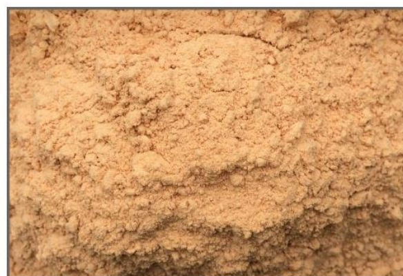
شکل ۵: آرد میگو

آرد میگو به طور اساسی حاصل خشک کردن همان ضایعات میگو شامل سفالوتوراکس و پوسته بخش شکمی است. تجزیه شیمیایی ضایعات میگو نشان می‌دهد که این ماده به ترتیب حاوی ۵۴، ۳، ۲/۵۵، ۹/۱۸، ۲۴/۲۷ و ۱۰/۲۵ درصد پروتئین خام، کلسیم، فسفر، کیتین، خاکستر و چربی است (Siddiq Ara et al., 2014). آرد میگو غنی از اسیدهای آمینه ضروری به‌خصوص لیزین، متیونین سیستئین، تریپتوفان و آرژنین است (Arab Jafari, 2001) (شکل ۵).