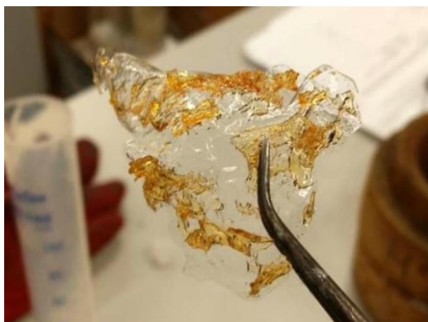
شکل ۳: فیلم کیتوسان تولید شده در مراحل اولیه ساخت

محققان در تلاش برای تولید کیسه‌های پلاستیکی قابل تجزیه در محیط زیست، توانستند با استفاده از پوسته میگو، پلیمری تولید کنند که شباهت زیادی به پلاستیک دارد. برای ساخت این پلیمر، محققان ابتدا کیتوسان را به صورت تکه‌های نازک جامد تولید کرده و سپس آن را در ترکیبی حل کردند که قبلاً با استفاده از روش‌های سنتی تولید پلیمر، یک فیلم پلاستیکی درون آن حل شده است. پلیمر به دست آمده از این تکنیک علاوه بر قابلیت تجزیه در محیط زیست، خاصیت ضد میکروبی و ویژگی‌های سازگار با محیط زیست دارد (New atlas, 2021) (شکل‌های ۳ و ۴).