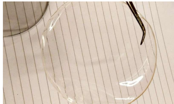
شکل ۴: فیلم کیتوسان پس از تولید

مراحل عمل‌آوری ضایعات میگو جهت استخراج کاروتنوئید ➤ شستشو و جدا کردن ضایعات اضافی.