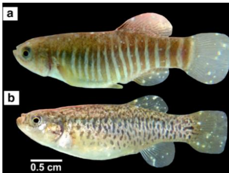
شکل ۲: تصویر تشکیل نقاط سفید بر روی باله و بدن ماهی Aphanius sophiae در آلودگی با انگل ایک، Ichthyophthirius multifiliis (Gholami et al., 2016). (a) ماهی نر؛ (b) ماهی ماده.