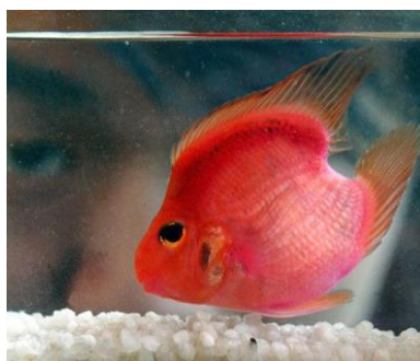
شکل ۲: Vieja melanura × Amphipodus citrinellus (https://en.wikipedia.org)