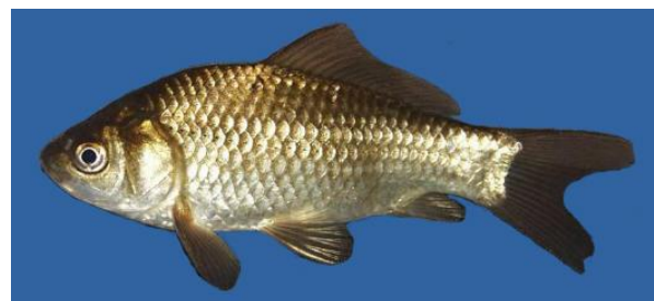
شکل ۱: ماهی طلایی ( C. auratus )

سرپوشش آبششی، پشت و روی باله سینه‌ای ظاهر می‌شود (Coad, 2017). ماهی طلایی به بزرگی کپور نمی‌رسد. طول استاندارد این گونه به طور معمول ۲۲۰-۱۲۰ میلی‌متر است. حداکثر طول استاندارد گزارش شده این گونه ۴۱۰ میلی‌متر است (Page and Burr, 1991). طول عمر معمول این گونه ۶-۷ سال است و حداکثر سن آن ۳۰ سال گزارش شده است (Robison and Buchanan, 1988).