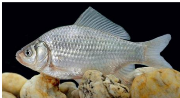
شکل ۳: ماهی کاراس ( C. gibelio ) (اقتباس از Froese and Pauly, 2010)

خارهای آبششی ۵۲-۳۷ عدد می‌باشد. (Kottelat and Freyhof, 2007). فلس‌های این گونه بزرگ‌تر از کپور طلایی بوده و به‌طور معمول دارای ۲۲-۲۷ فلس در امتداد خط جانبی است در حالی که تعداد فلس‌های خط جانبی در کپور طلایی معمولاً ۳۵-۳۱ عدد است (NatureGate, 2020). بر اساس گزارش Verreycken (۲۰۱۱) حداکثر طول کل برای این گونه ۴۶/۶ سانتی‌متر است. حداکثر سن گزارش شده برای این گونه نیز ۱۰ سال می‌باشد (Kottelat and Freyhof, 2007).