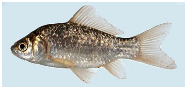
شکل ۵: کپور نقره‌ای ژاپنی ( C. langsdorfii ) (اقتباس از Froese and Pauly, 2020)

Kalous و همکاران (۲۰۰۷) نشان دادند که تعداد خارهای آبششی در C. langsdorfii ، ۵۷-۴۱ و در C. auratus ، ۴۷-۳۷ عدد می‌باشد.