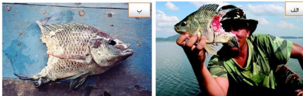
شکل ۵. تصاویری از الف - تیلایپای موزامبیک ( Oreochromis mossambicus ) و ب - تیلایپای آبی ( Oreochromis aureus ) که توسط سرمایه‌گذاری گول‌پیکر ( C. micropeltes ) مورد هجوم قرار گرفته‌اند. [عکاس: Jean-Francois Helias. (اقتباس از USGS, 2020 و Courtenay and Williams, 2004)]