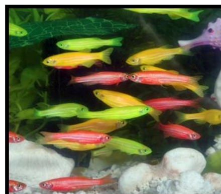
شکل ۱: گورخرهای تراریخته تولید شده با استفاده از ژن GFP، RFP و رنگ‌های تولید شده با استفاده از مهندسی ژنتیک و تغییر اسید آمینه‌های پروتئین مولد ژن رنگ

dsRed (مولد رنگ قرمز) از مرجان قارچی ( reniformis Entacmaea sp.)، شقایق دریایی ( Discosoma sp.)، مرجان سنگی ( Montipora efflorescens )، مرجان ونوس ( Anemonia sulcata ) را می‌توان برشمرد که حاوی رنگ‌های زیبایی می‌باشند (Chiang et al. , 2014). برای اینکه رنگ‌های متنوع بیشتری ایجاد گردد، چنانچه دو لاین ماهی گورخری حاوی پیشبر (mylz2) و پروتئین (GFP) و (RFP) با هم تلاقی داده شود، نسل حاصل رنگ نارنجی فلورسنس دارد. با مخلوط کردن عصاره استخراج شده عضله دو ماهی با عضلات فلورسنس قرمز و سبز، رنگ‌های فلورسنسی بینابینی از سبز، زرد، نارنجی تا قرمز دیده می‌شود (شکل ۱) (Wan et al. , 2002). بنابراین هیچ محدودیتی از نظر تولید رنگ ماهی تراریخته وجود نخواهد داشت. می‌توان دو رنگ را با استفاده از پیشبرهایی که قدرت تولید رنگ فلورسنس متفاوتی دارند با نسبت‌های متفاوت با هم مخلوط کرد.