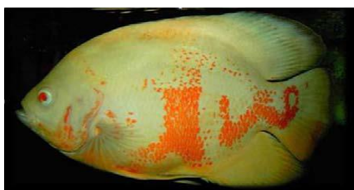
شکل ۴: اسکار زال