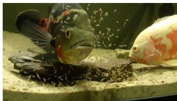
شکل ۵: تخم گذاری اسکار

تخم‌ها به یک سوبسترا (لایه) می‌چسبند و در یک لایه گسترش می‌یابند. آن‌ها درشت، به هم چسبیده و هنگام لمس شکننده هستند، تخم‌مرغی شکل بوده، قطب زرده بزرگ و یک فضای پری ویتیلینی کوچک دارند. تخم‌های بارور شده رنگ مایل به زرد دارند و در صورتی که بارور نشده باشند سفید کدر هستند. تخم‌ها در مدت ۳-۴ روز تخم‌گذاری می‌شوند و لارو یک کیسه زرده بزرگ دارد که در مدت ۴-۵ روز بعد از تخم‌گذاری به طور کامل جذب می‌شود. هر دو والدین چندین هفته از نوزادان نگهداری می‌کنند. اگر جفت اسکار در تشویش باشند، در استرس باشند یا احساس ناامنی کنند، تخم‌هایشان را می‌خورند. انتقال تخم‌ها به آکواریوم پرورش میزان بقاء آن‌ها را افزایش می‌دهد و باعث می‌شود فضای بیشتری برای رشد داشته باشند. جفت‌گیری نر و ماده با فعالیت‌هایی نظیر نوک زدن، تعقیب یکدیگر، تکان دادن شن و ماسه با دهان شروع می‌شود. هنگامی که تصمیم به جفت‌گیری گرفتند ناحیه‌ای را برای گذاشتن تخم‌هایشان آماده می‌کنند. اسکارهای نر و ماده‌ای که برای جفت‌گیری انتخاب می‌شوند باید حداقل دو سال داشته باشند. و همچنین دست کم یک بار جفت‌گیری و تخم‌ریزی کرده باشند. در صورتیکه به ناچار اسکارهای جوان را خریداری می‌کنید، آن‌ها را پرورش دهید تا بالغ شوند و صبر کنید تا شرکای خود را به طور طبیعی برای جفت شدن انتخاب کنند. این فرآیند ممکن است تا ۱۶ ماه طول بکشد.