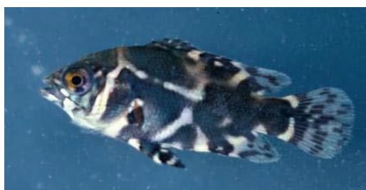
شکل ۲: اسکار جوان

در محیط آکواریوم، اسکارهای جوان رنگ متفاوتی نسبت به بالغین دارند. اسکارهای جوان دارای نوارهای سفید و نارنجی موج دار و نقاط سفید روی سر می باشند (Winemiller, 1990) (شکل ۲).