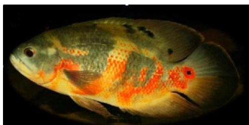
شکل ۳: اسکار نرمال

انواع نژادهای با رنگ‌های مختلف توسط تکثیر انتخابی برای تجارت آکواریومی، به‌ویژه نمونه‌های قرمز مسی و دارای لکه‌های سیاه یا حتی اشکال زال تولید شده‌اند (شکل‌های ۳ و ۴).