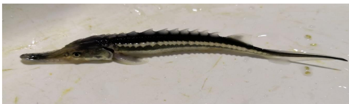
شکل ۲: بچه ماهی اوزون برون

گونه اوزون برون یا پوزه دراز بر خلاف سایر گونه های تاس ماهیان، دارای پوزه دراز و شمشیر مانند است که بیش از ۶۰ درصد طول سر آن را تشکیل می‌دهد. برجستگی‌های استخوانی ردیف پشتی ۹-۱۶ عدد، جانبی ۲۶-۴۳ عدد (بیشتر ۳۰-۳۸ عدد) و ردیف شکمی ۹-۱۴ عدد است. سیپلک‌ها کوتاه و بدون رشته و لب پایینی دارای بریدگی است. بدن این ماهی کشیده و باریک می‌باشد. برجستگی‌های استخوانی، تیز و در مقایسه با دیگر تاسماهیان بلندتر است. وزن معمول آن بین ۹ تا ۲۰ کیلوگرم است و طول آن به ۱۳۰ تا ۱۴۰ سانتی متر می‌رسد و در حدود ۱/۵ تا ۳ کیلوگرم خاویار از آن بدست می‌آید. این گونه ماهی مهاجری است که