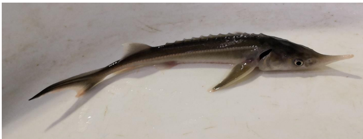
شکل ۱: بچه ماهی استرلیاد

برای تخم‌ریزی به رودخانه های حوضه زندگی خود می‌رود (آذری تاکامی، ۱۳۹۴). در شرایط پرورشی در سن ۶ سالگی بالغ شده و وزن مولدین ماده در این سن ۱۰ تا ۱۴ کیلوگرم و ۱/۵ کیلوگرم خاویار قابل استحصال دارد (بهمنی و همکاران، ۱۳۹۶). گوشت این ماهی حاوی ۱۹ درصد پروتئین و ۸/۶ درصد چربی و خاویار آن حاوی ۲۴ درصد پروتئین و ۱۰/۸ درصد چربی است (بهمنی و همکاران، ۱۳۹۶). این گونه در حوضه دریا‌های خزر، آزوف و سیاه زندگی می‌کند و در تمامی طول سواحل جنوبی و شمالی دریای خزر وجود دارد (بهمنی و همکاران، ۱۳۹۶).