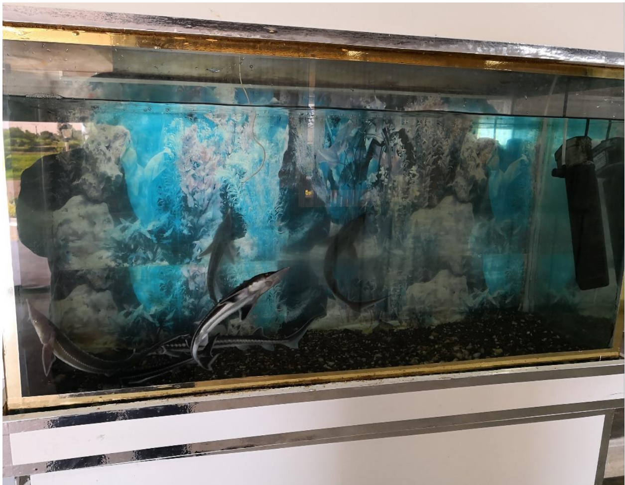
شکل ۳: آکواریوم آب شیرین نگهداری ماهیان خاویاری (از نمای روبرو)

سانتی متر، نیازمند یک آکواریوم با طول ۱۸۰ سانتی متر و عرض ۶۰ سانتی متر است. عمق از اهمیت کمتری برخوردار بوده، ولی بیشتر بودن حجم آب، شرایط زیست محیطی پایدار تری را فراهم مینماید. نمای روبرویی از یک آکواریوم آب شیرین ماهیان خاویاری در شکل ۳ مشاهده می‌گردد.