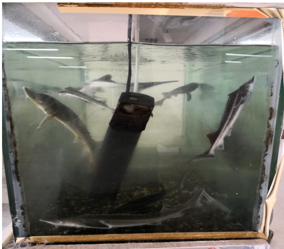
شکل ۴: آکواریوم آب شیرین نگهداری ماهیان خاویاری (از نمای جانبی)

زمان نگهداری در آکواریوم و مخازن، نیازمند غذای عمدتاً با منشا حیوانی هستند. نمای جانبی آکواریوم آب شیرین ماهیان