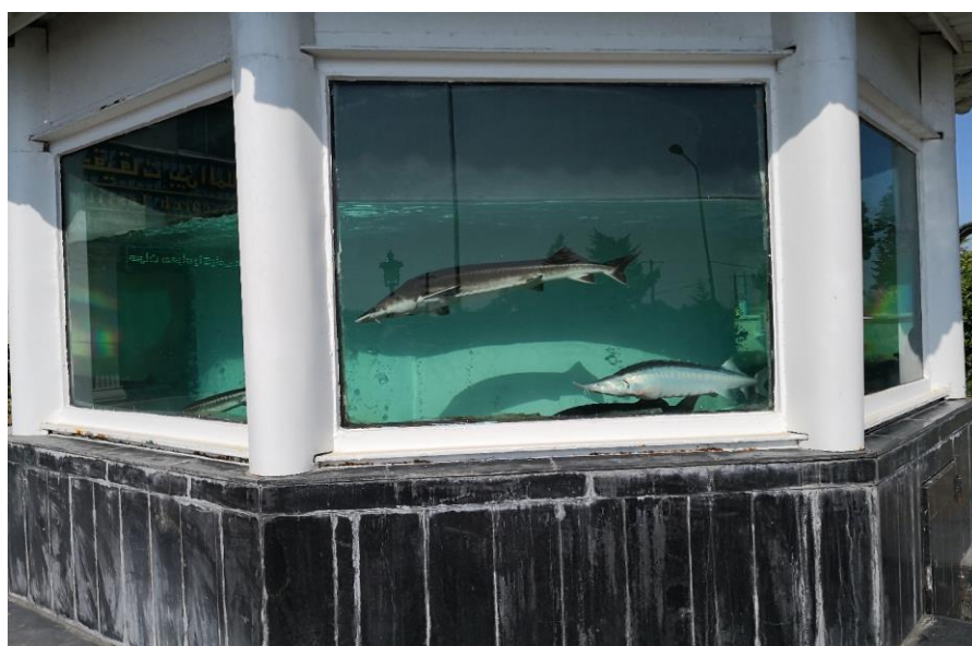
شکل ۶: آکواریوم بزرگ آب شیرین ماهیان خاویاری به مساحت ۱۲ متر مربع (۶ ضلعی)

اولین چالش در نگهداری این ماهیان دمای آب است. ماهیان خاویاری نیازمند غذای مناسب هستند (غذاهای ساخته شده از دانه گندم یا غلات را نمی‌خواهند). به آب حاوی مقدار کافی از اکسیژن و فیلتر شده نیاز دارند. در طول ماه‌های تابستان نیازمند پمپ هوا میباشند. ماهیان خاویاری بسترهای نرم (سنگ‌های با حاشیه گرد و صاف) را ترجیح داده و از قرار دادن هرچیز با حاشیه تیز و برنده در بستر باید اجتناب نمود. در زمان گرسنگی، از ذخایر بافت عضلانی استفاده نموده و در نتیجه، ماهی عضلات خود را از دست داده و سرانجام قادر به حرکت نبوده و بزودی میمیرد. بروز خمیدگی در کمر این ماهیان نشان دهنده فقر غذایی است. اگر ماهیان خاویاری دائما در حاشیه مخزن نگهداری، بالا و پایین بروند نشانگر گرسنه بودن آنها میباشند. با بالاتر رفتن دمای آب در فصل بهار، ماهیان خاویاری فعال تر شده و نیازمند غذای بیشتر هستند. غذا باید در مقادیر کم و در دفعات بیشتر داده شود. در مجموع بهترین زمان غذایی صبح و غروب است. باقی ماندن غذای حاوی مقادیر زیاد پروتئین در کف آکواریوم میتواند منشاء ورود نیتريت به آب آکواریوم باشد. تعویض قسمتی از آب آکواریوم، میتواند مقدار نیتريت را به حد قابل قبول برساند. Zharkenov et al., (2016). در تابستان ماهیان خاویاری خیلی خوب تغذیه