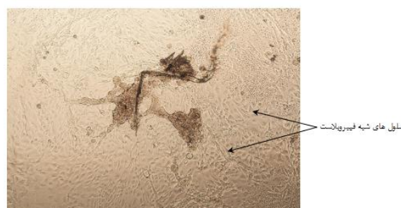
شکل ۵: تکثیر بافت تخمدان و مهاجرت سلول‌های جدید به سمت خارج از بافت (۱۲۰×)

Epler, P., Galas, J. and Stoklosowa, S., 1997. Steroidogenic activity of carp ovarian