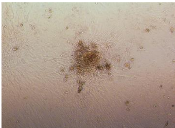
شکل ۳: تکثیر بافت تخمدان و مهاجرت سلول‌های جدید به سمت خارج از بافت (×۱۲۰)

تکثیر بافت کشت داده شد تخمدان و مهاجرت سلول‌های تکثیر یافته ادامه یافت و با گذشت زمان بیشتر شد. بررسی نمونه‌ها در روز دهم نشان داد سلول‌ها به خوبی تکثیر شدند و به نزدیک تکه‌های بافتی مجاور رسیدند (شکل ۴).