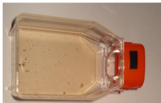
شکل ۱: تکه‌های کشت شده بافت تخمدان پس از ۴۸ ساعت

بررسی نمونه کشت داده شده پس از گذشت تقریباً ۳۶ ساعت، نشان داد تقریباً ۹۰ درصد تکه‌های بافتی (explants) کشت داده شده تخمدان ماهی قرمز به کف فلاسک کشت چسبیدند (شکل ۱). بررسی نمونه کشت داده شده به وسیله میکروسکوپ اینورت نشان داد بعد از گذشت ۱۴ روز اغلب تکه‌های بافتی تخمدان بخوبی به کف فلاسک چسبیده بودند (شکل ۲) و سلول‌های آن‌ها تکثیر یافته، به سمت خارج از بافت یعنی به طرف محیط کشت مهاجرت نمودند (شکل ۳).