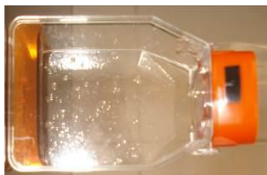
شکل ۲: تکه‌های کشت شده بافت تخمدان در روز چهاردهم