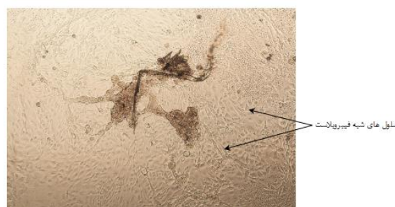
شکل ۵: تکثیر بافت تخمدان و مهاجرت سلول‌های جدید به سمت خارج از بافت (۱۲۰×)

Epler, P., Galas, J. and Stoklosowa, S., 1997. Steroidogenic activity of carp ovarian