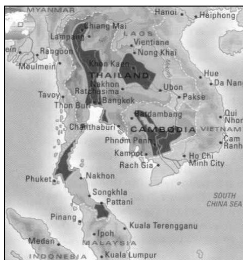
شکل ۱: نقشه توزیع ماهی جنگجو در حوزه آبی رودخانه مکنونگ

مردم سیام و مالایا (تایلند و مالزی کنونی) نخستین مردمانی بودند که در قرن ۱۹ میلادی، ماهی فایتر را از حیات‌وحش جمع‌آوری نموده و در منازل خود نگهداری کردند. در نتیجه تکثیرهای برنامه‌ریزی شده رنگ‌های متنوع (از سفید، سبز روشن، آبی روشن، قرمز روشن، زرد تا سبز تیره، آبی تیره، قرمز تیره، بنفش، مشکی، با طرح‌های خال‌دار، چند رنگ و...) و انواع دم چادری و امروزی آن به خوبی پرورش داده شده‌اند. حداکثر طول جنس نر این ماهی تا ۶/۵ سانتی‌متر و بیش‌ترین طول عمر آن‌ها تا ۲ سال گزارش شده است. این ماهی در پی‌اچ ۶ تا ۸ و سختی ۵ تا ۱۲ درجه آلمانی به خوبی قادر به زیست خواهد بود. دمای ۲۴ تا ۳۰ درجه سانتی‌گراد، بهترین دامنه حرارتی ماهی جنگجو را شامل می‌شود. پلانکتون‌های جانوری ۴ ، لارو پشه و دیگر حشرات اصلی‌ترین منابع غذایی این ماهی را در طبیعت شامل می‌شوند. جنس نر ماهی جنگجوی سیامی در تمام طول عمر خود، رفتار پرخاشگرانه داشته و در هنگام