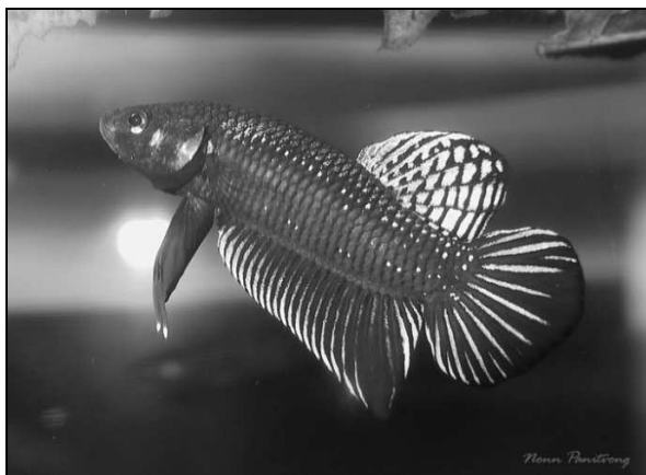
شکل ۲: ماهی جنگجوی نر صید شده از طبیعت

در حیات وحش برای زمان‌های نسبتاً کوتاهی، شاهد نزاع و درگیری جنس‌های نر این ماهی خواهید بود، چرا که در اغلب موارد آن‌ها ترجیح می‌دهند، کم‌ترین آسیب ممکن را متحمل شوند، لذا ماهی ضعیف‌تر به سرعت عقب‌نشینی کرده و محل را ترک می‌کند. در واقع فایتر وحشی به ندرت اهل مبارزه است و تنها وقتی می‌خواهد از قلمرواش دفاع کند یا جفت‌گیری نماید، تن به مبارزه می‌دهد. چنین مبارزاتی به نمایش قدرت محدود شده و به نشان دادن سرپوش‌های آبخشی باز شده و باله‌های برافراشته محدود می‌شود. به طور حتم پیدا کردن یک قلمرو جدید، حتی اگر چندان هم برای تولیدمثل مناسب نباشد، قطعاً از مرگ خیلی بهتر است (شکل های ۲ و ۳).