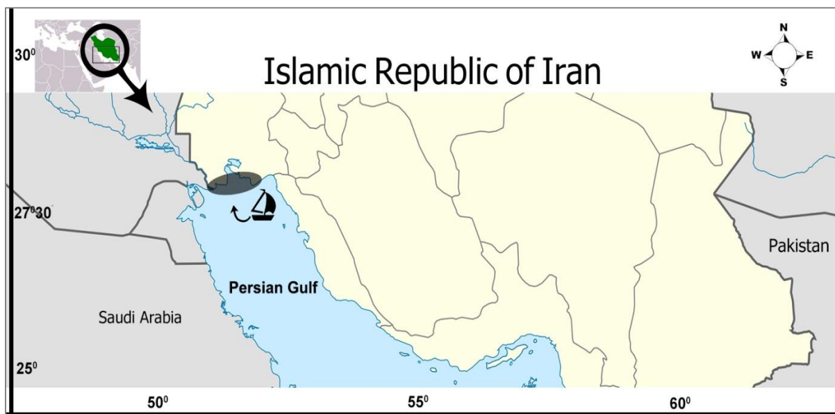
شکل ۱: نقشه منطقه مورد مطالعه

آزمایشگاه به مدت چند ساعت جهت هضم مقدماتی نگهداری شدند. سپس نمونه‌ها روی پلیت داغ با درجه حرارت ۱۴۰ درجه سانتی‌گراد به مدت ۵ ساعت قرار داده شد تا هضم کامل انجام پذیرد. نمونه‌ها به وسیله کاغذ صافی ۴۲ میکرون فیلتر گردیده و با آب حجم آنها به ۲۵ میلی لیتر رسانده شد. غلظت فلزات سنگین نمونه‌های آماده شده با استفاده از دستگاه جذب اتمی (PERKINELMER 4100) مورد سنجش قرار گرفت. برای اندازه‌گیری فلزات کادمیوم، سرب و آرسنیک از دستگاه طیف سنجی جذب اتمی شعله‌ای و برای سنجش جیوه از دستگاه طیف سنجی جذب اتمی با روش تولید بخار سرد اقدام شد. به موازات آماده‌سازی نمونه‌ها، ۳ نمونه شاهد نیز به‌طور جداگانه و با همان نسبت اسید و آب مقطر تهیه و اندازه‌گیری شد (Moopan, 1999). جهت اندازه‌گیری عناصر مورد نظر ابتدا با ۱۰ میلی لیتر محلول هضم شده نمونه‌ها ۵ میلی لیتر محلول آمونیوم پیرولیدین کاربامات ۵ درصد اضافه شده و به مدت ۲۰ دقیقه نمونه‌ها شیکر شدند تا عناصر به‌صورت فرم آلی فلزی در محلول کمپلکس شوند و سپس به نمونه‌ها ۲ میلی لیتر متیل ایزوبوتیل کتون اضافه شد و به مدت ۳۰ شدند. پس از تنظیم کوره و سیستم منبع تولید اشعه کاندی دستگاه واپتیمم کردن دستگاه جذب اتمی منحنی