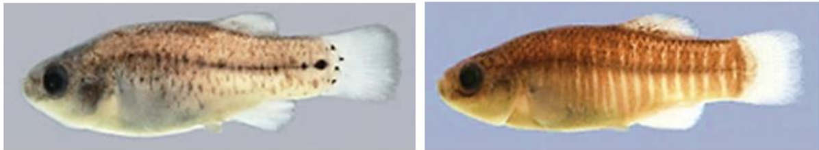
شکل ۱: نمای جانبی جنس نر (سمت راست) و جنس ماده (سمت چپ) گونه Aphanius arakensis برگرفته از مقاله تیموری و همکاران (۲۰۱۲)

متفاوت بوده و جنس نر دارای نوارهای مشخص عمودی به تعداد ۱۹-۱۲ (معمولاً ۱۱-۱۳) عدد می‌باشند. در ماده‌ها الگوی رنگی به شکل نقاطی در امتداد پهلوها به علاوه لکه‌های بزرگتر در بخش میانی و پشتی می‌باشد. این گونه دارای ۱۹