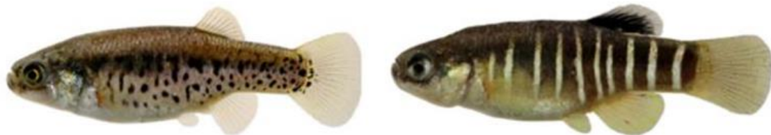
شکل ۱۱: نمای جانبی جنس نر (سمت راست) و جنس ماده (سمت چپ) گونه Aphanius shirini برگرفته از غلامی و همکاران (۲۰۱۴)

گونه Aphanius shirini (Gholami et al., 2014) کپور دندان‌دار شیرین یا خسرو شیرین (شکل ۱۱): بومی ایران است و غلامی و همکاران (۲۰۱۴) آن را در رودخانه کر در حوضه کر توصیف نمود. این گونه دارای باله پشتی با ۱۲-۱۰ و باله مخرجی با ۱۱-۱۰ شعاع نرم است و با داشتن ۱۷ آپومورفی مولکولی ثابت در ژن سیتوکروم b به راحتی در سطح ژنتیکی از گونه‌های ایرانی قابل تشخیص است. از لحاظ