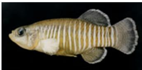
شکل ۸: نمای جانبی جنس نر (سمت راست) و جنس ماده (سمت چپ) گونه Aphanis pluristriatus . برگرفته از اسماعیلی و همکاران (۲۰۱۲)

پهلوی بوده و ماده‌های بالغ دارای رنگ مایل به آبی به همراه نقاط قهوه‌ای در پهلوها می‌باشند. این گونه ساکن آب شیرین و نواحی گرمسیری است با دمای ۲۹-۲۲ درجه سانتی‌گراد زندگی می‌کند. وضعیت آن در IUCN ارزیابی نشده است (Froese and Pauly, 2021).