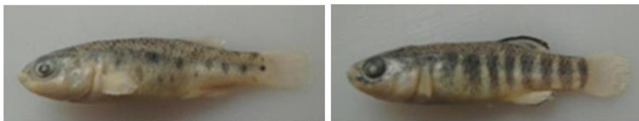
شکل ۶: نمای جانبی جنس نر (سمت راست) و جنس ماده (سمت چپ) گونه Aphanius isfahanensis .

گونه Aphanius isfahanensis (Hrbek et al., 2006) کپور دندان‌دار اصفهان (شکل ۶): بومی ایران است و Hrbek و همکاران (۲۰۰۶) آن را در حوضه اصفهان توصیف نمودند. این گونه دارای باله پشتی با ۱۰-۱۳ و باله مخرجی با ۱۰-۱۲ شعاع نرم است و به‌وضوح از لحاظ ژنتیکی از سایر گونه‌ها به‌واسطه داشتن ۸۲ آپومورفی مولکولی متمایز است. جنس نر را می‌توان با داشتن لبه سیاه متمایز در باله‌های