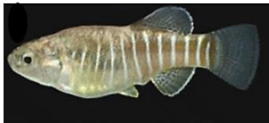
شکل ۱۰: نمای جانبی جنس نر (سمت راست) و جنس ماده (سمت چپ) گونه Aphanis sophiae . برگرفته از اسماعیلی و همکاران (۲۰۱۲)