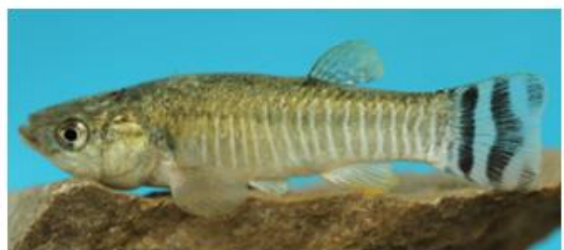
شکل ۵: نمای جانبی جنس نر (سمت راست) و جنس ماده (سمت چپ) گونه Aphanis ginaonis . برگرفته از مقاله تیموری و اسماعیلی (۲۰۲۰)