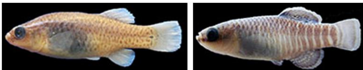
شکل ۲: نمای جانبی جنس نر (سمت راست) و جنس ماده (سمت چپ) گونه Aphanius darabensis . برگرفته از مقاله اسماعیلی و همکاران (۲۰۱۴)

گونه Aphanius darabensis Esmaili (Teimori et al., 2014) - کپور دندان‌دار داراب (شکل ۲): بومی انحصاری ایران است و اسماعیلی و همکاران (۲۰۱۴) آن را در حوضه آبریز هرمز توصیف کردند و دارای باله پشتی با ۱۱-۱۵ و باله مخرجی با ۱۰-۱۳ شعاع نرم می‌باشد. این گونه از لحاظ فیلوژنی گروه خواهری A. shirini است و به واسطه داشتن ۹-۱۸ نوار کناری در جنس نر (در مقابل ۷-۱۰ در A. shirini )، لکه‌های عمودی نامنظم و کوچک با رنگ قهوه‌ای