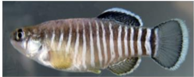
شکل ۳: نمای جانبی جنس نر (سمت راست) و جنس ماده (سمت چپ) گونه Aphanis farsicus . برگرفته از مقاله تیموری و همکاران (۲۰۱۱)

گونه‌های موجود در ایران متمایز می‌شود. این گونه ساکن رودخانه‌ها و چشمه‌های فصلی با آب کم‌عمق و دارای لایه‌های نازک سفید نمک در اطراف و غالباً در حاشیه رودخانه‌ها جایی که آب کم‌عمق، گرم با جریان کند است، زندگی می‌کند. وضعیت این گونه در IUCN ارزیابی نشده است (Froese and Pauly, 2021).