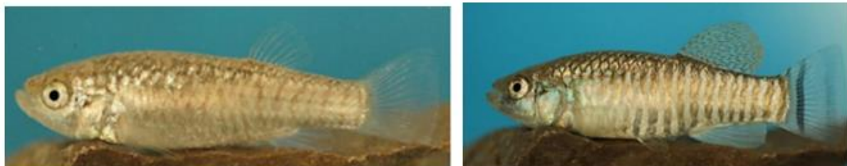
شکل ۱۲: نمای جانبی جنس نر (سمت راست) و جنس ماده (سمت چپ) گونه Aphanius hormuzensis برگرفته از تیموری و همکاران (۲۰۱۸)

گونه Aphanius hormuzensis (Teimori et al., 2018) کپور دندان‌دار هرمز (شکل ۱۲): بومی ایران است و در ابتدا تیموری و همکاران (۲۰۱۸) آن را به عنوان یکی از اعضاء جنس Aphanius hormuzensis از حوضه هرمز توصیف نمودند. این گونه دارای باله پشتی و مخرجی مثلی شکل با حاشیه دیستال صاف تا کمی مقعر و باله‌های