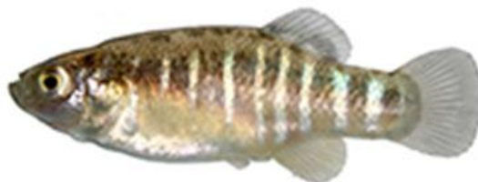
شکل ۹: نمای جانبی جنس نر (سمت راست) و جنس ماده (سمت چپ) گونه Aphanis vladykovi . برگرفته از اسماعیلی و همکاران (۲۰۱۴)

۱۷-۱۰ شعاع نرم است. جنس ماده دارای لکه‌های ظریف و جنس نر دارای ۲۱-۱۰ نوار در پهلو هستند. این گونه ساکن آب شیرین بوده و در آبهای شور و لب شور کمتر دیده شده و وضعیت آن در IUCN ارزیابی نشده است (Froese and Pauly, 2021).