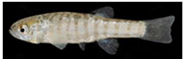
شکل ۴: نمای جانبی جنس نر (سمت راست) و جنس ماده (سمت چپ) گونه Aphanis furcatus . برگرفته از مقاله تیموری و همکاران (۲۰۱۴)

مخرجی با ۹-۷ شعاع نرم است. جنس نر دارای ۲ نوار عمودی تیره بر روی باله دمی است که در برخی نمونه‌ها Y شکل است و در جنس ماده وجود ندارد. این گونه ساکن آب گرم شیرین است. وضعیت آن در IUCN ارزیابی نشده است (Froese and Pauly, 2021).