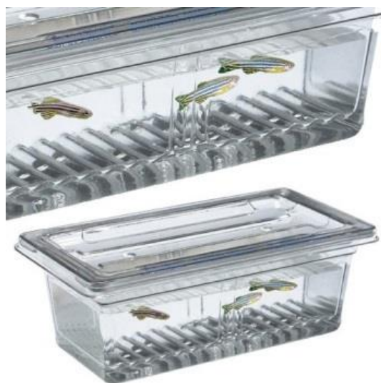
شکل ۳: نمونه‌ای از مخازن فایبرگلاس شیب‌دار (بالا) و ساده (پایین) مخصوص تکثیر ماهی دانیوی گورخری