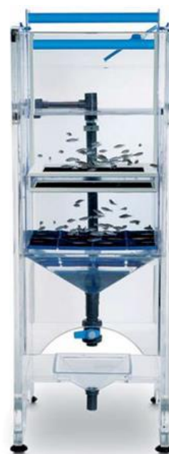
شکل ۱: نمونه مخزن پیشرفته iSpawn برای تکثیر ماهی دانیوی گورخری

علاوه بر مخازن پیشرفته iSpawn، استفاده از مخازن فایبرگلاس شیب‌دار ۴ یا مخازن ساده تجهیز با ادوات در دسترس (تجهیز با توری دارای ابعاد مناسب چشمه ۵ در بستر مخزن) در میان تولیدکنندگان خرد و متوسط ماهی گورخری رواج دارد. طراحی مخازن فایبرگلاس شیب‌دار کوچک (با ۱/۷ لیتر گنجایش) بر مبنای ایده خلاقانه و براساس مدل رفتاری تولیدمثلی این ماهی در بسترهای شیب‌دار (برای تشویق و تحریک تخم‌ریزی) ترسیم شده است. مولدین پس از تخم‌ریزی امکان تغذیه از تخم‌های موجود در بستر مخزن را نخواهد نداشت. استفاده از حائل جدا کننده موجود در این مخازن، این امکان را به تکثیر کننده می‌دهد تا ماهی‌ها در گروه‌های کوچک‌تری تقسیم کرده و برای جفت شدن به طور اختصاصی عمل کند (شکل ۳). در برخی منابع حجم مخزن پیشنهادی برای تکثیر این ماهی ۶۰ سانتی‌متر طول و ۳۰ سانتی‌متر عرض و ارتفاع (۵۴ لیتر) پیشنهاد شده است (Lambert, 2001). برخی منابع تنها حدود ارتفاع (عمق) آب مخزن مورد نیاز جهت تکثیر این ماهی را ۱۵ سانتی‌متر (معادل ۶ اینچ) توصیه کرده‌اند (Alderton, 2019). در سایر منابع محدودیت خاصی در مخازن نگهداری یا تکثیر اعلام نشده است.