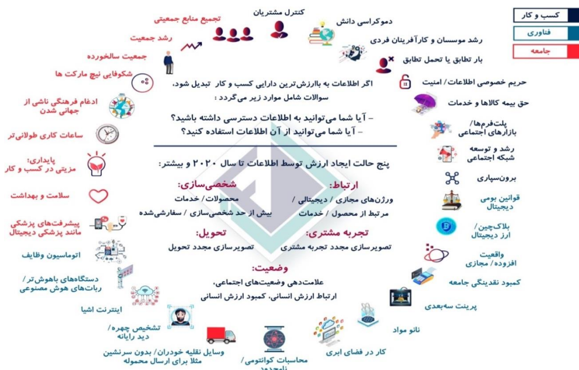
شکل ۱: مولفه‌های اصلی تشکیل دهنده رادار استراتژیک

هنگام ساخت رادار استراتژیک، با ۲۹ عامل شکست و ۸ سوال ماهیتی روبرو هستیم ( خزایی، ۱۳۹۹). سوالات ماهیتی به رابطه بین کسب و کار و زمینه فعالیت می‌پردازد. عوامل شکست همان چیزی است که عملاً بیان می‌شود (برای مثال، شکست محتوا، ورشکستگی، عدم موفقیت صنعت ماهیان زینتی در جهان) (شکل ۱).