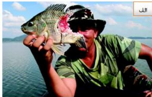
شکل ۵. تصاویری از الف - تیلاپیای موزامبیک ( Oreochromis mossambicus ) و ب - تیلاپیای آبی ( Oreochromis aureus ) که توسط سرماری گول پیکر ( C. micropeltes ) مورد هجوم قرار گرفته‌اند. [عکاس: Jean-Francois Helias. (اقتباس از USGS, 2020 و Courtenay and Williams, 2004)]