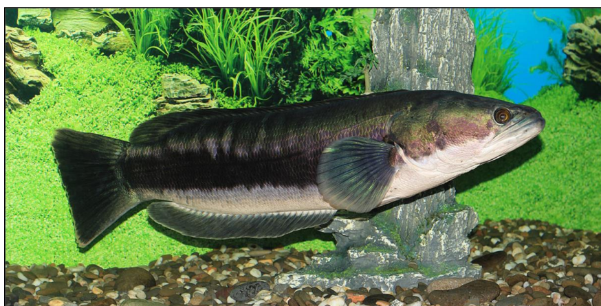
شکل ۲: ماهی سرماری گول‌پیکر ( Channa micropeltes ) (اقتباس از Seriously Fish, 2020)

این گونه دارای بدن بلند و کشیده است. دارای باله پشتی و مخرجی طویل می‌باشد (شکل ۲) و شکل مسطح و فلس‌های روی سرشان یادآور سر مارها می‌باشد (Pijper, 2020). فک پایین این ماهی به سمت جلو حرکت کرده است. باله‌ها فاقد شعاع سخت هستند (Froese and Pauly, 2019). شعاع‌های باله پشتی ۴۳-۴۶، شعاع‌های باله مخرجی ۳۰-۲۷، شعاع‌های باله سینه‌ای ۱۵ و شعاع‌های باله شکمی ۶ عدد می‌باشند (CABI, 2020). باله شکمی حدود ۵۰ درصد طول باله سینه‌ای است (Musikasinthorn and Taki, 2001).