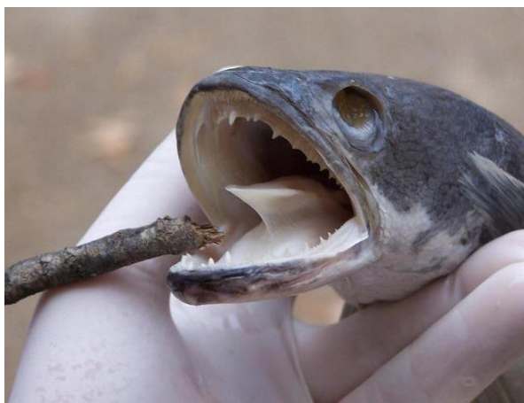
شکل ۳: دندان‌های قوی و تیز در سرماری غول‌پیکر ( C. micropeltes ) جهت برش طعمه (اقتباس از: Grubaugh, 2020)

ماهیان سرماری شکارچیان کمین‌گر هستند و در بخش‌های ساکن آب در رودخانه‌های بزرگ زیست می‌کنند (Coad, 2016). گونه C. micropeltes در درجه اول، یک تغذیه کننده روز هنگام ۳ است. Mohsin و Ambak (۱۹۸۳) و Roberts (۱۹۸۹) اظهار داشتند که این گونه یک شکارچی اختصاصی است که می‌تواند به سایر ماهیان حمله کرده و بدون این‌که آنها را مصرف کند، از بین ببرد. آنها بیان کردند که C. micropeltes دارای دندان‌های بزرگ و قوی (شکل ۳) با دو لبه برش عمود بر محور بدن است که امکان برش بخش‌هایی از گوشت را در طعمه‌های بزرگ فراهم می‌کند (Ng and Lim, 1990).