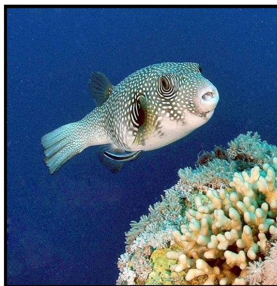
شکل ۹: بادکنک ماهی خال سفید ( Arothron hispidus )