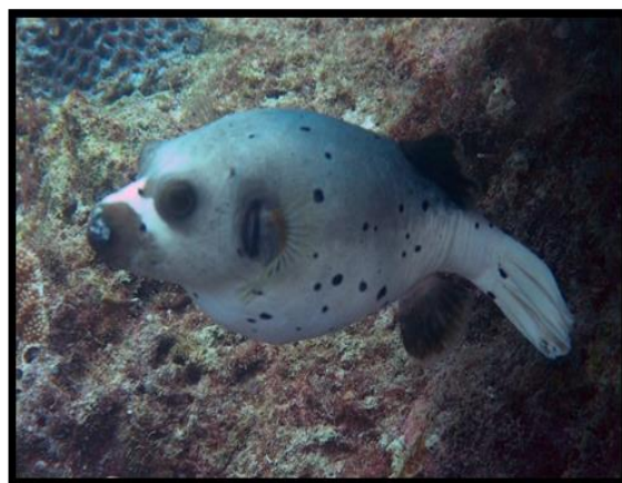
شکل ۸: بادکنک ماهی خال سیاه ( Arothron nigropunctatus )

بادکنک ماهی خال سیاه نام علمی (Arothron nigropunctatus) یک گونه از تیره بادکنک ماهیان است. اندازه متوسط بادکنک ماهی خال سیاه ۳۳ سانتی‌متر بوده و این گونه در آب‌های باز در اقیانوس هند تا جزایر مرکزی اقیانوس آرام، اقیانوس هند و قسمت‌های وسیعی از دریای سرخ در اعماق ۲۵ متری زندگی می‌کند. بادکنک ماهی خال سیاه از اسفنج دریایی، جلبک، مرجان و سخت‌پوستان و نرم‌تنان تغذیه می‌کند (شکل ۸) (Yotsu- Yamashita et al. , 2018).