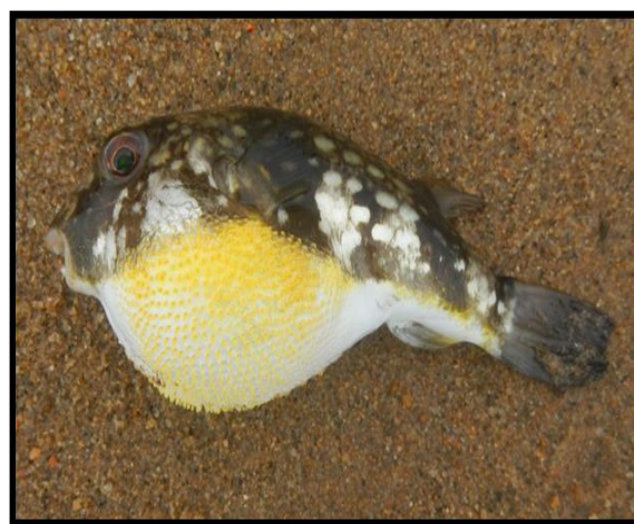
شکل ۱: بادکنک ماهی خال‌شیری ( Chelonodon patoca )

بادکنک ماهیان که فوگل ماهیان و بادکنک ماهیان چهار دندان (Tetraodontidae) نیز نامیده می‌شوند با نام انگلیسی Puffer fish معروف بوده و تا به حال حدود ۱۲۰ گونه ماهی بادکنکی در جهان مورد شناسایی قرار گرفته است. بیشترین علت معروفیت ماهی بادکنکی، به علت سازگاری منحصر به فرد این ماهی برای دفاع از خود است. ماهی‌های بادکنکی در فهرست سمی‌ترین حیوانات جهان، پس از قورباغه سمی طلایی در رتبه دوم قرار دارند. بادکنک ماهیان به گونه‌ای تکامل یافته‌اند که می‌توانند به هر دو سو و حتی به عقب شنا کنند. آن‌ها در هنگام ترس یا رویارویی با خطر بدن خود را با بلعیدن آب تا چند برابر متورم می‌کنند (Kleitou et al., 2018). این ماهی در آب‌های گرمسیری سراسر جهان یافت می‌شود، اما به ندرت به آب‌های سرد رفته و در آب‌های جنوبی ایران نیز زندگی می‌کنند که معروف‌ترین گونه در ایران، گونه بادکنک ماهی خال‌شیری ( Chelonodon patoca ) است (شکل ۱) (Yotsu-Yamashita et al., 2018).