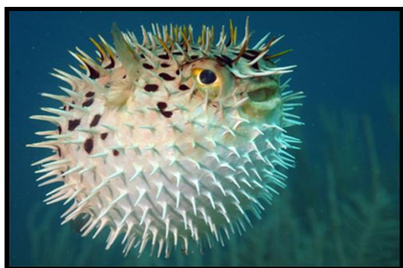
شکل ۲: بادکنک ماهی هنگام رویارویی با ترس

توانایی خارق‌العاده دفاعی ماهی بادکنکی این است که در هنگام مواجهه با خطر، به سرعت بدن خود را باد کرده و تیغ‌های سمی بلندی که سطح بدن را می‌پوشاند نشان می‌دهد. لمس خارهای سمی ماهی بادکنکی هم برای انسان و هم حیوانات کشنده خواهد بود (شکل ۲) (Kanazawa, 2017).