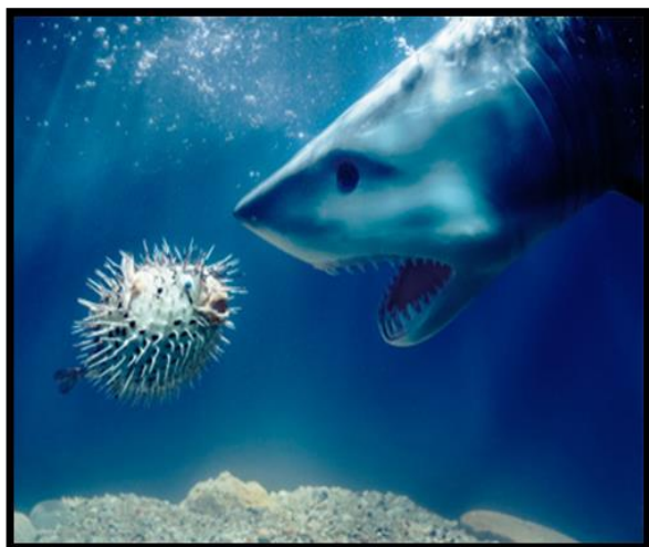
شکل ۵: تغذیه کوسه از بادکنک ماهی

کوچک‌ترین گونه ماهی بادکنکی، ماهی بادکنکی کوتوله است. این ماهی خیلی کوچک بوده که طول آن به حدود ۳ سانتی‌متر می‌رسد. با وجود اینکه ماهی بادکنکی کوتوله با انواع دیگر ماهی بادکنکی هم‌خانواده است، ولی در دریا وجود ندارد و صرفاً دریکی از رودخانه‌های هند دیده می‌شود (شکل ۶) (Kosker et al. , 2018b).