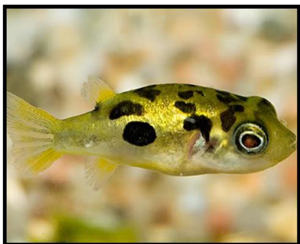
شکل ۶: بادکنک ماهی کوتوله خال زرد ( Torquigener flavimaculosus )

کوچک‌ترین گونه ماهی بادکنکی، ماهی بادکنکی کوتوله است. این ماهی خیلی کوچک بوده که طول آن به حدود ۳ سانتی‌متر می‌رسد. با وجود اینکه ماهی بادکنکی کوتوله با انواع دیگر ماهی بادکنکی هم‌خانواده است، ولی در دریا وجود ندارد و صرفاً دریکی از رودخانه‌های هند دیده می‌شود (شکل ۶) (Kosker et al. , 2018b).