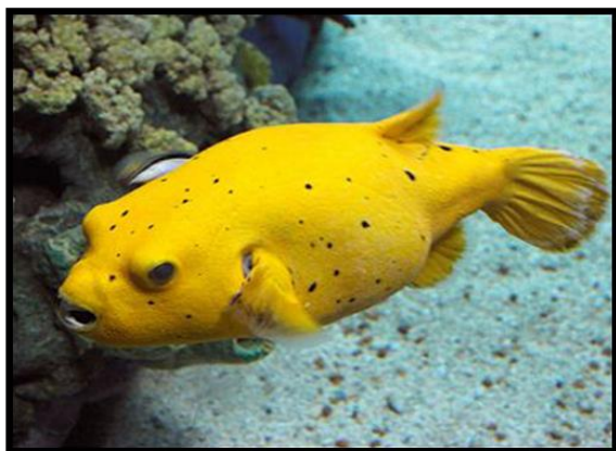
شکل ۳: شکل دهان و چشم بادکنک ماهی

ماهی بادکنکی ممکن است تا طول ۶۰ سانتی‌متر رشد کند، اما اندازه ماهی بادکنکی، به نوع گونه این حیوان بستگی دارد. ماهی بادکنکی در رنگ‌های گوناگون یافت می‌شود، ولی تشخیص رنگ آن‌ها زمانی که باد نکرده‌اند، ممکن است برخی از مواقع مشکل باشد. ماهی بادکنکی معمولاً شبیه یک بچه وزغ بزرگ است و چشمانی بزرگ و دهانی کشیده دارد (شکل ۳) (Acar et al., 2017).