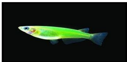
شکل ۳: ماهی آکواریومی مداکا با استفاده از پیشبر mylz2

با استفاده از این تکنولوژی در ماهی مداکا هم ژن‌های فلورسنس با رنگ‌های متفاوت کلون شدند که این ماهیان را با چشم غیرمسلح هم می‌توان دید. با انتقال ژن فلورسنس نوعی از مرجان‌های دریایی با پروموتور (mylz2)، لاینی از ماهی مداکا تراریخته ای را ایجاد شده است که رنگ سبز روشن تری دارد (شکل ۳) (Zeng et al. , 2005).