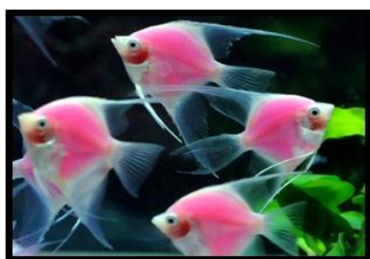
شکل ۲: ماهی آکواریومی آنجل تولید شده توسط محققان تایوانی با استفاده از پیشبر ویروسی

از ژن‌های گزارشگر متفاوتی استفاده شده است از آن جمله می‌توان به (lac Z) و (GFP) و کلرامفینیکل استیل ترانسفراز (CAT) ۴ اشاره کرد. از مشکلات استفاده از ژن‌های پیشبرهای دیگر غیر از خود جانور، عدم هماهنگی آن‌ها می‌باشد که باعث می‌شود بیان ژن انتقال داده شده به جانور به حالت (خاموش) ۵ یا حالت (متنوع) ۶ باشد یا اصلاً بیان ژنی دیده نشود (Chen et al. , 2015).