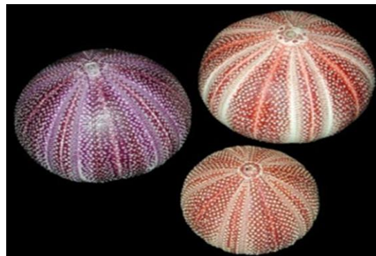
شکل ۱: اسکلت داخلی توتیای دریایی

کشورهای مدیترانه و برخی دیگر از کشورهاست. این محصول یکی از گران‌ترین غذاهای دریایی در ژاپن است.