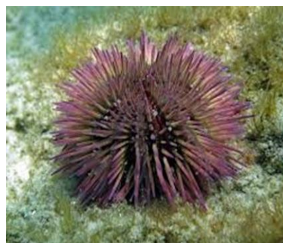
شکل ۵. توتیای دریایی صورتی

خود هستند. سیستم آبرسانی بدن آنها به صورت حفره‌های طبیعی است که توسط تعداد زیادی برآمدگی کوچک به نام پا (podia) به بیرون راه می‌یابد.