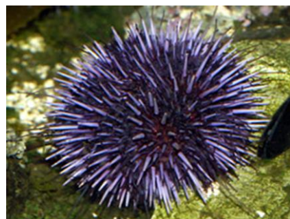
شکل ۶. تنوع رنگ در توتیای دریایی

همچنین دارای یک ساختار چنگاله مانند کوچکی در میان خارهای خود می‌باشند که نه تنها برای دفاع و بدست آوردن مواد غذایی از آن استفاده می‌کنند، بلکه در تمیز نگهداشتن بدن توتیای دریایی حیاتی هستند. رنگ توتیاها نیز شیئی زیبایی این جانوران و پتانسیل آنها به عنوان یک آبی زینتی می‌باشد. رنگ آنها بسیار متغیر و متفاوت است. مهم‌ترین رنگ آنها بترتیب شامل سیاه، قرمز، قهوه ای، ارغوانی و صورتی روشن است. همچنین دارای صدها لوله شفاف هستند که از سطح بیرون زده‌اند و به آنها اجازه می‌دهد که به