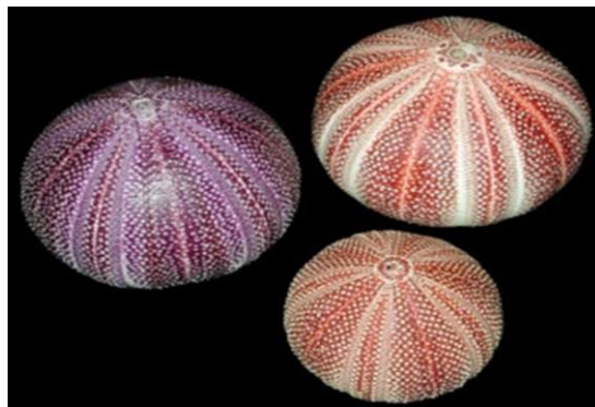
شکل ۱: اسکلت داخلی توتیای دریایی

کشورهای مدیترانه و برخی دیگر از کشورهاست. این محصول یکی از گران‌ترین غذاهای دریایی در ژاپن است.