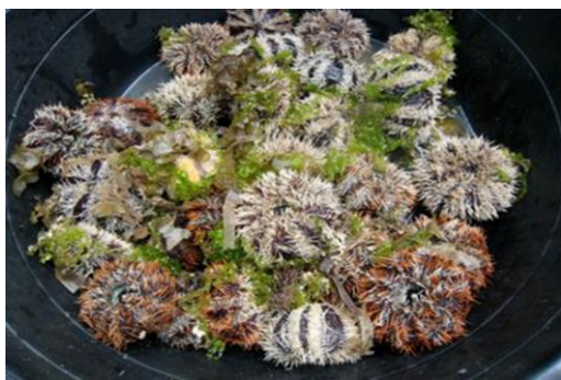
شکل ۲. پرورش توتیای دریایی

صورت می‌گیرد. از جمله این روش‌ها می‌توان به سیستم سینی کم‌عمق اشاره کرد که شامل یک سری سینی است که هر کدام به سینی بالایی متصل شده‌اند. هر سینی دارای شیبی است که جریان آب را توسط نیروی ثقل زمین به سمت پایین هدایت می‌کند. آب در سینی بالایی توسط یک مخزن ذخیره آب و با کمک یک پمپ جریان می‌یابد و هر سینی آب را به طور مستقیم از سینی بالایی دریافت می‌کند و در نهایت آب با یک حرکت زیگزاگی به مخزن بازمی‌گردد (Grosjean et al. , 1998). از دیگر روش‌ها، سیستم تراف‌های مخزن‌دار و پرورش توتیا در قفس است که خلیج‌های کوچک و خورها می‌توانند مکان مناسبی برای توتیا باشند، با این حال برای انتخاب یک مکان مناسب باید به وجود علف‌های دریایی، جریان بالای آب و جزر و مد ناگهانی، فاقد شرایط آب و هوایی بد، عمق مناسب برای جلوگیری از خشک شدن توتیا، منطقه فاقد آلودگی، نزدیک به ساحل بودن و در مسیر کشتیرانی واقع نشدن توجه کرد که با توجه به موارد مذکور، می‌توان خلیج‌ها و خورها را به عنوان مکان‌هایی مناسب برای پرورش در قفس توتیا در نظر گرفت (Malay et al. , 2000) (شکل ۲).