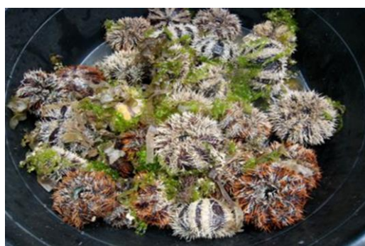
شکل ۲. پرورش توتیای دریایی

صورت می‌گیرد. از جمله این روش‌ها می‌توان به سیستم سینی کم‌عمق اشاره کرد که شامل یک سری سینی است که هر کدام به سینی بالایی متصل شده‌اند. هر سینی دارای شیبی است که جریان آب را توسط نیروی ثقل زمین به سمت پایین هدایت می‌کند. آب در سینی بالایی توسط یک مخزن ذخیره آب و با کمک یک پمپ جریان می‌یابد و هر سینی آب را به طور مستقیم از سینی بالایی دریافت می‌کند و در نهایت آب با یک حرکت زیگزاگی به مخزن بازمی‌گردد (Grosjean et al. , 1998)، از دیگر روش‌ها، سیستم تراف‌های مخزن‌دار و پرورش توتیا در قفس است که خلیج‌های کوچک و خورها می‌توانند مکان مناسبی برای توتیا باشند، با این حال برای انتخاب یک مکان مناسب باید به وجود علف‌های دریایی، جریان بالای آب و جزر و مد ناگهانی، فاقد شرایط آب و هوایی بد، عمق مناسب برای جلوگیری از خشک شدن توتیا، منطقه فاقد آلودگی، نزدیک به ساحل بودن و در مسیر کشتیرانی واقع نشدن توجه کرد که با توجه به موارد مذکور، می‌توان خلیج‌ها و خورها را به عنوان مکان‌هایی مناسب برای پرورش در قفس توتیا در نظر گرفت (Malay et al. , 2000) (شکل ۲).