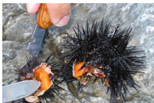
شکل ۳. رسیدگی جنسی در توتیای دریایی

(Kawahara, 1995) غدد جنسی توتیای دریایی دارای یک نوع سلوع غیرجنسی به نام فاگوسیت‌های مغذی برای ذخیره مواد غذایی و نوع دیگری از سلول‌های جنسی به نام سلول‌های زاینده، سلول‌های پایه جهت تولید تخمک و اسپرم می‌باشند. بخش عمده رشد غدد جنسی در مراحل اولیه شامل رشد و ذخیره مواد مغذی می‌باشد. پس از ذخیره مواد مغذی، فرآیند گامتوژنز شروع می‌شود و مواد غذایی انبار شده همگام با تولید تخمک در ماده‌ها و اسپرم در جنس نر، مصرف می‌گردد (شکل ۳).