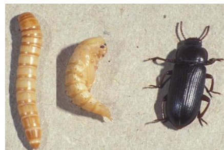
شکل ۱: مراحل زندگی سوسک زرد آرد

زیست‌شناسی و اکولوژی: هرچند سوسک زرد آرد بومی اروپا است، ولی امروزه دارای پراکنشی جهانی بوده و در اکثر مناطق دنیا یافت می‌شود. از دیدگاه خسارت‌زایی، حشره‌ای با درجه اهمیت متوسط است و از انواع غلات و فرآورده‌های آسیاب شده آنها تغذیه می‌کند. هرچند آنها غلات در حال پوسیدگی و یا آسیاب شده دارای رطوبت را ترجیح می‌دهند ولی می‌توانند از مواد دیگری چون آرد، سبوس، نان، گوشت، پر پرندگان و حشرات مرده نیز تغذیه نمایند. آنها در مرحله لاروی از جنین و بخش‌های نرم دانه‌ها تغذیه می‌کنند، ولی در مرحله حشره کامل بیشتر از سایر حشرات موجود در محیط تغذیه می‌نمایند. در طبیعت فرم زمستان‌گذران به صورت لارو می‌باشد که در بهار و یا اوایل تابستان بعد از طی مرحله شفیرگی به حشره کامل تبدیل می‌شوند (شکل ۱) (ارباب، ۱۳۹۱).