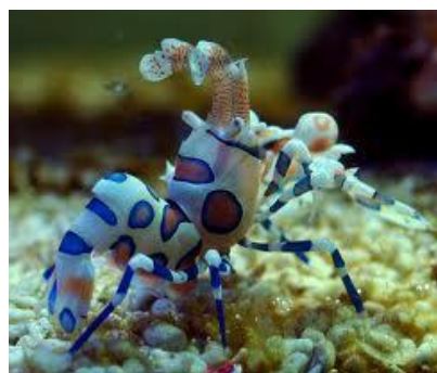
شکل ۱۰: از بالا به پایین: چلچله ساحلی ( Bank swallow ) و دلقک میگوی دریایی ( Clown shrimp )

۳- فرضیه اجبار ماده به تک‌همسری نر: در برخی از جانداران، نر برای تک‌همسری سازگار نشده است، اما ماده او را مجبور می‌کند که با او بماند و در نگهداری از فرزندان کمک کند.