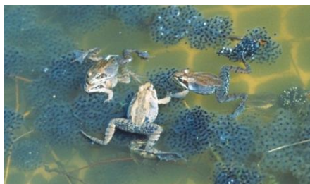
شکل ۵: خرچنگ نعل اسبی و قورباغه