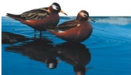
شکل ۷: به ترتیب از بالا به پایین: Spotted sand pipers، پرنده گردن قرمز و فالاروپس قرمز

۳) چندگانگی نر ماده (Polygynandry) یا جفتگیری دسته جمعی (Promiscuity) این نوع جفتگیری اغلب در سیستم‌هایی اتفاق می‌افتد که به طور مشخص چندگانگی ماده (Polygyny) دارند. زمانی که یک جمعیت برای نرها آن قدر بزرگ می‌شود که نمی‌توانند جفت‌های خود را منحصرأ برای خود نگه دارند، در این سیستم یک فرد از یک جنس که درون یک گروه اجتماعی است، با سایر اعضاء جنس مخالف جفتگیری می‌کند. به عبارت دیگر،