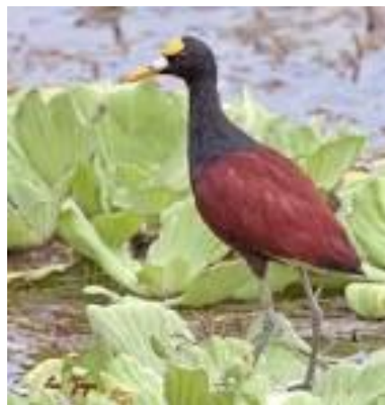
شکل ۶: پرنده Northern jacanas

هر ماده قلمرو بزرگی را حفظ می‌کند که شامل قلمروهای آشیانه‌ای کوچکتر شامل ۲ یا چندین نر هستند که از تخم‌ها و نوزادان مراقبت می‌کنند. مانند پرنده ساحلی Northern jacanas. در این سیستم ماده‌ها ممکن است با تمام نرها در یک روز جفتگیری کنند و هرکدام از نرها را برای دفاع از قلمروی خودش کمک می‌کنند (شکل ۶).