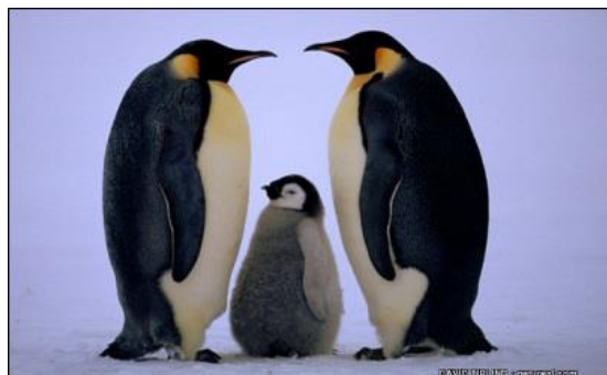
شکل ۱: سیستم جفت‌گیری تک‌همسری در پنگوئن امپراطور

تک‌همسری ممکن است در زمان کوتاهی از زندگی پستانداران وجود داشته باشد که این سیستم جفت‌گیری در کمتر از ۱ درصد پستانداران دیده می‌شود که معمولاً با حفاظت والدینی همراه است. پنگوئن امپراطور از پرندگان آبی است که سیستم جفت‌گیری تک‌همسری دارد (شکل ۱).