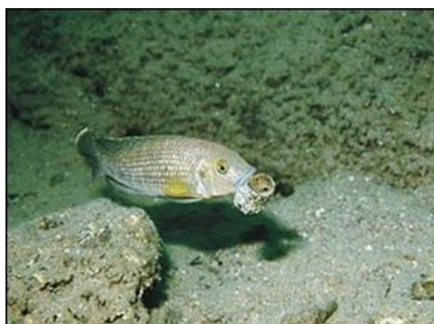
شکل ۲: ماهی نر سیچلید آفریقایی در حال جمع‌آوری پوسته صدف‌ها