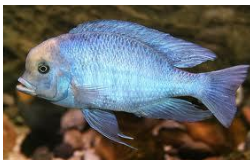
شکل ۴: Cyrtocara eucinostomus

شکل ۳: فیل‌های دریایی و زمرد ماهی سرآبی از گونه‌هایی هستند که تشکیل حرمسرایبی از ماده‌ها می‌دهند و در برابر نرهای دیگر بسختی می‌جنگند.