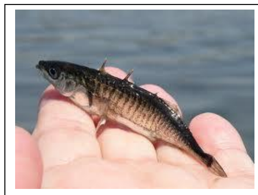
شکل ۸: ماهی سه خار

در این سیستم هر کدام از نرها ممکن است با یک ماده در پرورش زاده‌ها کمک کند، اگرچه تمام بالغین برای پرورش تمام زاده‌ها کمک می‌کنند. این سیستم عمدتاً تولید مثل اجتماعی (Communal breeding) نامیده می‌شود. در این سیستم انتخاب جفت کم است یا وجود ندارد. همچنین مراقبت والدینی از جوانترها به ندرت اتفاق می‌افتد یا هرگز وجود ندارد، مانند ماهی سه خار (Stickleback) (شکل ۸).