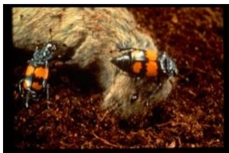
شکل ۱۱: سوسک حفار ( Burying beetle )

نکته قابل توجه این است که اگرچه سیستم‌های جفت‌گیری و استراتژی‌های تولید مثل در جانداران متنوع است، اما در تمامی آنها یک وجه اشتراک وجود دارد و آن اینکه موجود باید برای بقاء خود حداکثر تلاش را انجام دهد و بقاء موجودات نیز نتیجه زاد و ولد است و بدین منظور سیستم‌های تولید مثلی نیز تحت تاثیر تنوع شرایط اکولوژیک و سیر تکاملی جانداران متنوع هستند (Moller et al., 2001).