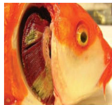
شکل ۱: علائم بالینی بیماری در آبشش ماهیان مبتلا به کوی هرپس ویروس (KHV)