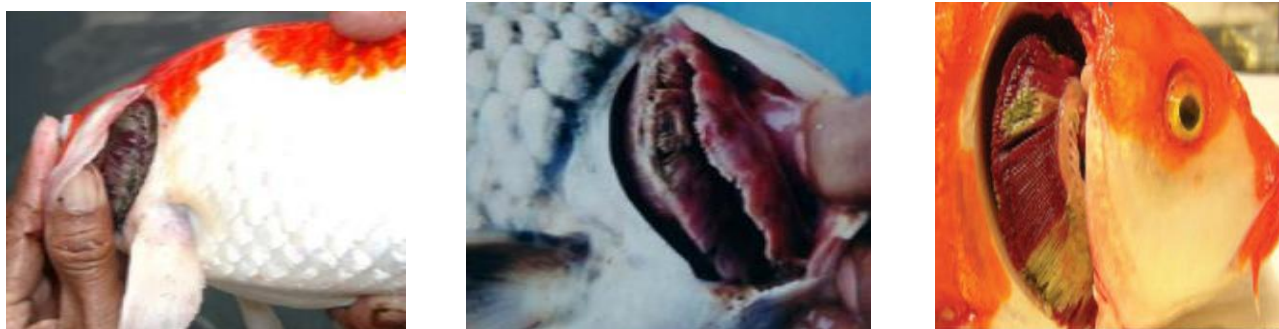
شکل ۱: علائم بالینی بیماری در آبشش ماهیان مبتلا به کوی هرپس ویروس (KHV)